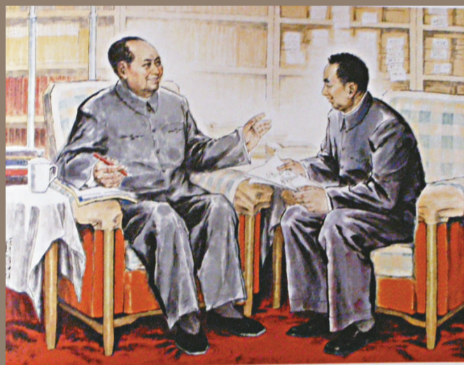
▲《你辦事，我放心》，設色紙本，一九七六年創作