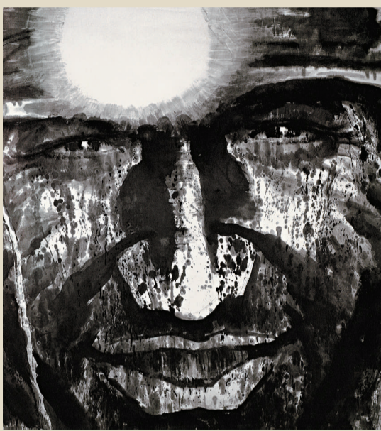
▲《山中的太陽》，入選百年中國畫展並收入畫集