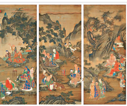
▲四條屏明代《十六羅漢圖》 西安立邦藝術公司提供

美術史學者姚永柱認為，這幅古畫之所以沒有落款，可能有兩種原因，一是仇英的款識通常在畫的邊緣部位，可能此圖傳到日本再次裝裱時落款被裁掉；二是畫面中有一位身穿官服的供養人，雙手持笏板，面相似龍若豬的男子，流傳下來的明太祖朱元璋畫像便有如此形象，朱元璋出過家，信奉佛教。所以宋明王朝的後輩子孫或貴族委託仇英創作此畫，懸掛於皇家寺院，不便落款。