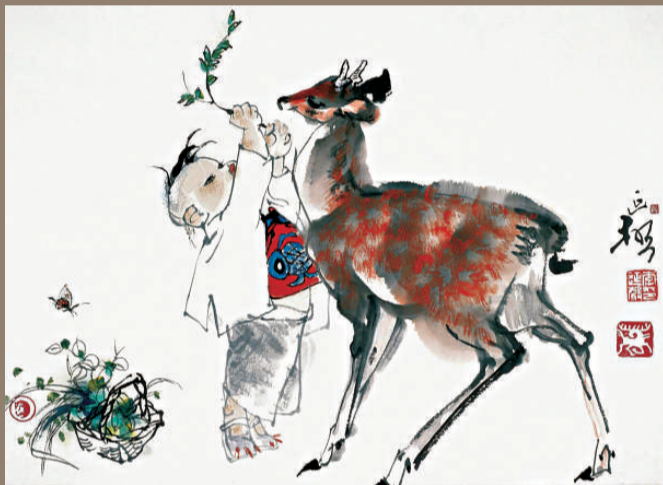
▲《小草》，一九八五年作，二〇〇五年參加「黃胄師生精品展」並收入畫集