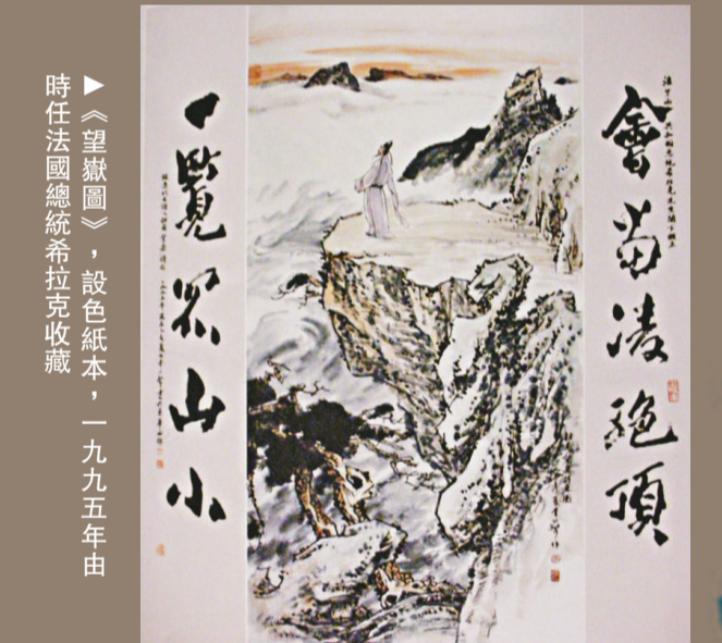
▲《覽眾山小》，設色紙本，一九九五年由時任法國總統希拉克收藏