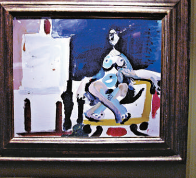
▲畢加索《畫室裡的模特兒》