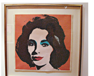
▲首爾拍賣安迪沃荷多幅作品，其中一幅《莉莎》

一九六五年。藝術大師安迪沃荷以絲印混合油彩而成的《毛澤東》（估價六百萬至八百萬港元），結合中國政治宣傳及大眾文化化，曾引起一時哄動，至今吸引力仍然不減；雷諾阿的《花瓶》則估價三百二十至三百八十萬港元。