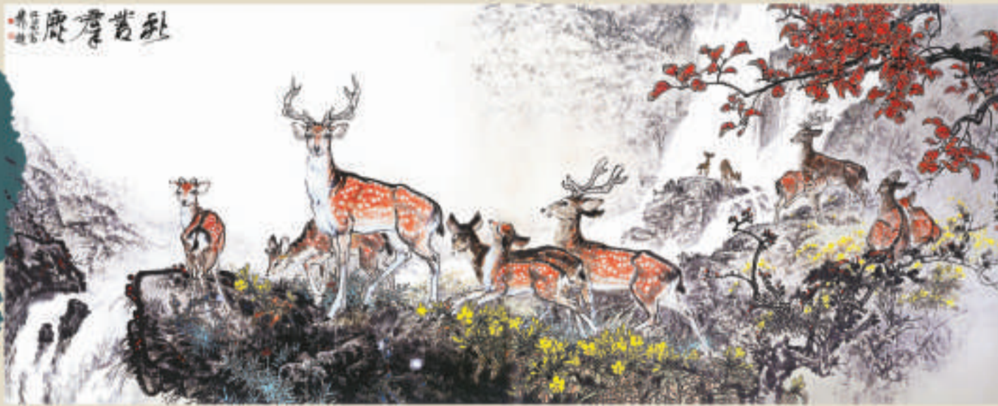
▲《秋叢群鹿》，一九八三年收藏於中南海會議室