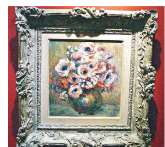
▲構圖典雅、筆觸細膩動人的雷諾阿《花瓶》

九八五）出生於俄國維台普斯克小鎮一個猶太教家庭，年輕時曾赴巴黎學畫，數年後返回故鄉結婚，其後再度離鄉旅居巴黎，不久第二次世界大戰爆發，面對離鄉別井及生靈塗炭，夏加爾深感哀痛，也啟發他以宣揚愛為一生之創作主題。在他的畫中，鳥、牛羊、馬戲團演員及新娘經常出現，《動物寓言與音樂》也不例外，畫面以黑色為底色，再施以藍綠紅黃四種顏色，描繪象徵性的人及動物，透過絲絲筆觸表達出鄉愁與愛的幻象。此畫成於一九六九年，這一年法國文化部決定興建「國立夏加爾聖經訊息美術館」，該美術館在四年後建成。