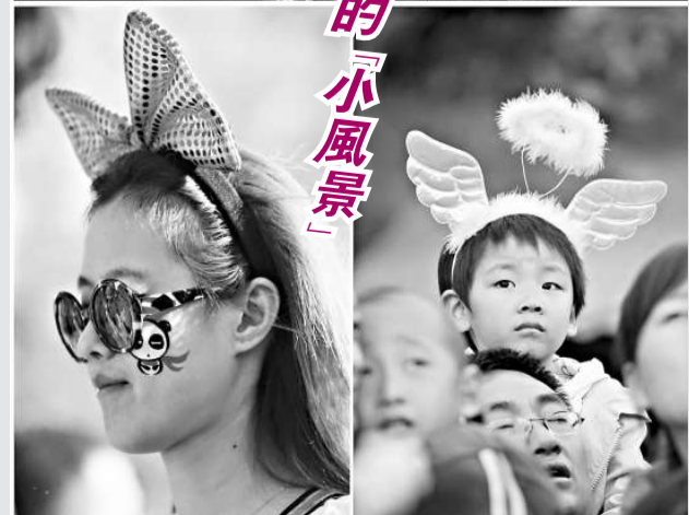
國慶長假期間，一些遊客和市民用各種飾品和彩繪把自己打扮得美麗別致，宛如一道道美麗的「小風景」。圖為裝扮各異的遊客3日在北京歡樂谷遊玩（拼版圖片）。