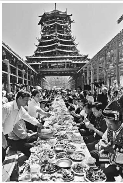
▲廣西三江侗族自治縣在三江風雨橋上舉辦「百家宴」活動，吸引數千名嘉賓和遊客前來共享侗家美食，體驗侗家文化。

不僅僅是桂林，廣西南寧、北海、百色、賀州等地景區、景點在黃金周也是大熱，前往北海瀾洲島的遊船「一票難求」，北海銀灘一天湧入遊客九萬餘人次，廣西多地景區都出現遊人摩肩接踵的情形。