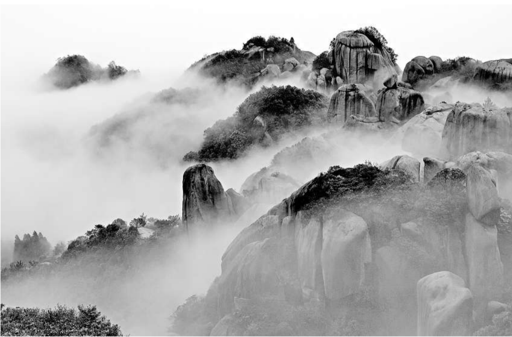
►霧氣繚繞、山巒疊翠的「海上仙都」寧德太姥山

寧德此次被列入「世界地質公園」的主體以白水洋、太姥山、白雲山三個園區為核心，總面積2639.4平方公里。公園位於鷲峰山脈東南側，亞熱帶季風濕潤氣候，特殊的地理位置和地貌條件，造成公園內晶洞花崗岩地貌、火山岩地貌、河床侵蝕地貌、海蝕地貌的完美結合，構成了「山海川島湖林洞」的奇特景觀。世界地質公園評委、中國地質科學院研究員趙遜表示，寧德地質公園地質遺跡豐富多彩，且類型齊全，是對民眾進行普及地質科學知識的好課堂。