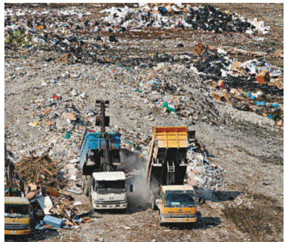
▲將軍澳堆填區擴展計劃遭立法會議員及區議員反對

【本報訊】政制及內地事務局局長將在本月二十日的立法會會議上，提出《2010年區議會條例（修訂附表3）令》動議，內容是由二〇一二年一月一日起第四屆區議會任期開始，在六個區議會增加七個民選議席。如動議獲立法會通過，選舉管理委員會便會按新的議席數目及法定的劃界準則，進行二〇一一年區議會選舉的選區劃界工作。選舉管理委員會將於稍後時間公布全港四百一十二個區議會選區分界的臨時建議並諮詢公眾，及按照法例規定向行政長官提交最終建議。