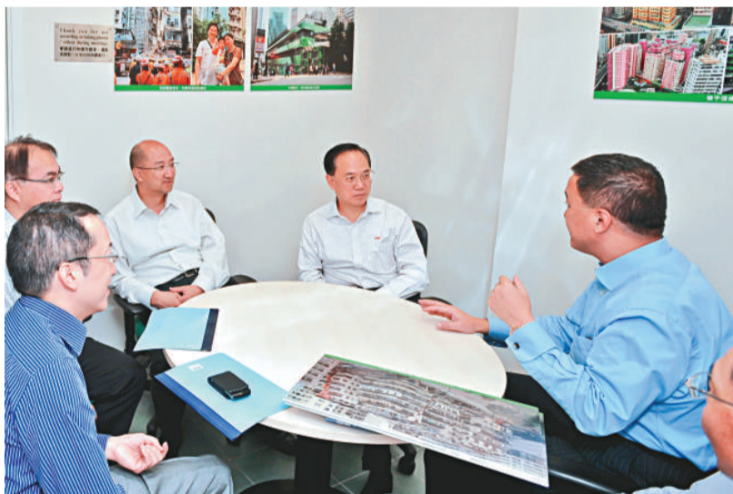
▲曾蔭權到九龍城視察市區重建項目，並探訪兩個受惠於該項目的家庭

他表示，越來越多市民要求市區更新要加強社區參與、提高透明度，對保留地區文化的情懷亦有所提升，因此推動未來的市區更新計劃，必須強調「由下而上」及以地區為本，仔細聆聽舊區居民的需要和訴求，是檢討市區更新策略時的主要議題。而且，市區更新計劃亦有助更好地運用市區土地，興建更多中小型住宅單位，以滿足市民的需要。