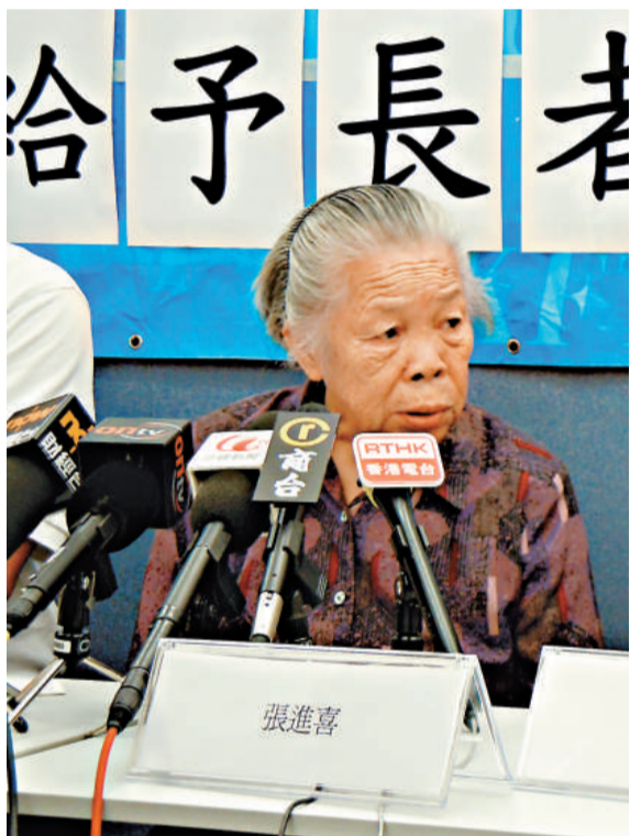
▲張婆婆每個月靠千餘元過活，為慳錢要執紙皮及到公廁喝生水

另外，樂群社會服務處和工聯會合作，今年農曆年後在油蔴地推出「十元優惠午餐」，每日招待四五十人，當中七成為長者，主辦機構冀能將計劃推廣至其他地區。