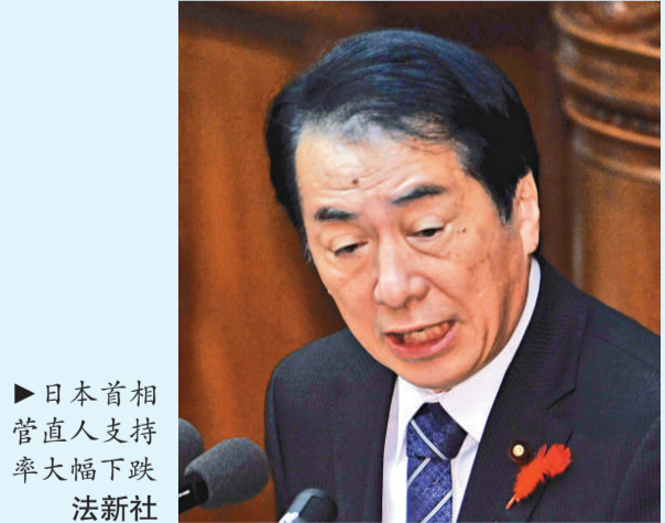
▶日本首相菅直人支持率大幅下跌

日本共產黨委員長志位和夫，4日早上會見內閣官房長官仙谷由人時，要求東京政府向中國及國際社會，理直氣壯地表明日本擁有釣魚台島的主權。仙谷回應指，政府的立場與共產黨基本一致，會向首相菅直人轉達志位和夫的要求。