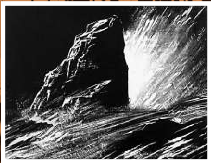
▲作品《砥》 一九九四年