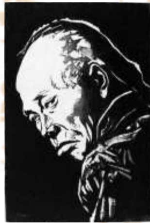
▲《阿Q正傳之一》 一九七八年