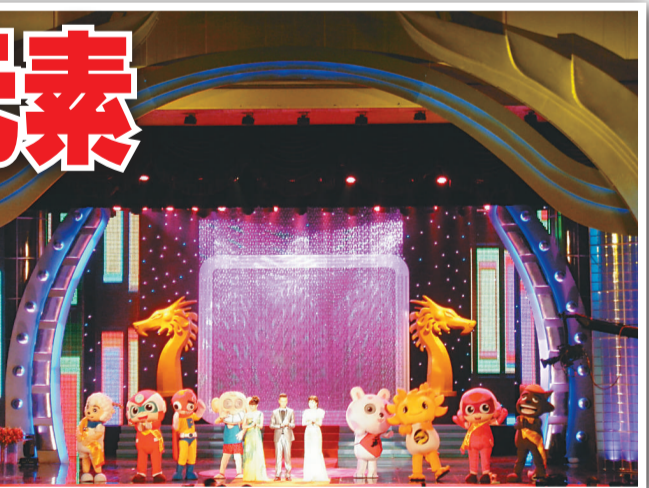
▲不同造型的卡通人物亮相動漫版權交易會 本報攝

另外，第四屆中國漫畫家大會亦同時在廣州召開，百餘名中國內地及港澳台漫畫家，與法國、日本、韓國、馬來西亞等地的動漫大師共聚一堂，探尋具有中國特色的漫畫產業之路。中國國際漫畫節於十月九日閉幕。