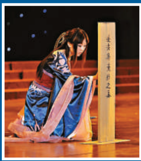
▲COSER在台上詮釋她心中的動漫形象 ▼動漫角色展示舞技