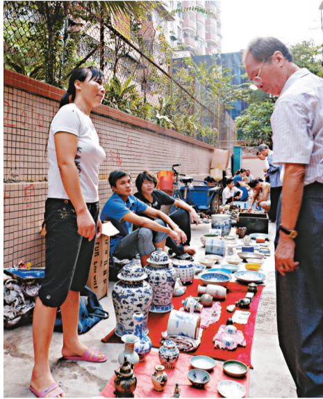
▲廣州西關文昌北路的天光墟，密密麻地排着一個個攤檔