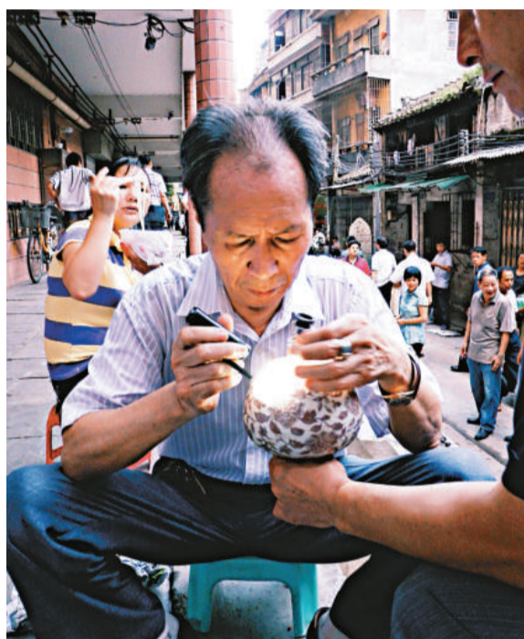
▲小手電和放大鏡是鑑別古物必備的工具

根據廣東省收藏家協會統計，目前廣東收藏界的正規軍，即協會會員及符合入會資格但還沒完成審批手續的準會員，已多達50萬人，隱於民間的收藏愛好者更是不計其數。不過，在當前全國狂熱的收藏潮流中，廣東的收藏行為大多被定義為有錢沒文化的投機取巧，或是廣東人專賣假貨。