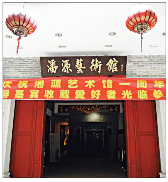
▲藏身鬧市之中的潘源藝術館