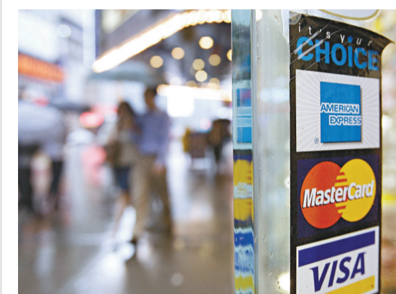
▲一家紐約商舖外貼著美國運通卡、萬事達卡和Visa卡的標誌 資料圖片