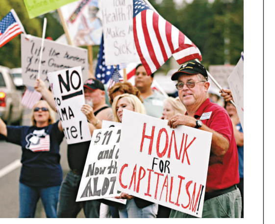
▲美「茶黨」支持者在亞利桑納州集會 資料圖片

州長選舉的一項紀錄早已被惠特曼打破了。這位謀求代表共和黨出選、取代阿諾舒華辛力加擔任加州州長的eBay公司前行政總裁，迄今已花去1.19億美元，比彭去年競選連任紐約市長時的花費還要多1000萬美元。