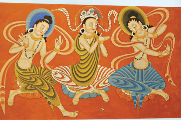
「敦煌循跡」之《供養菩薩》，莫高窟第二六三窟（北魏）