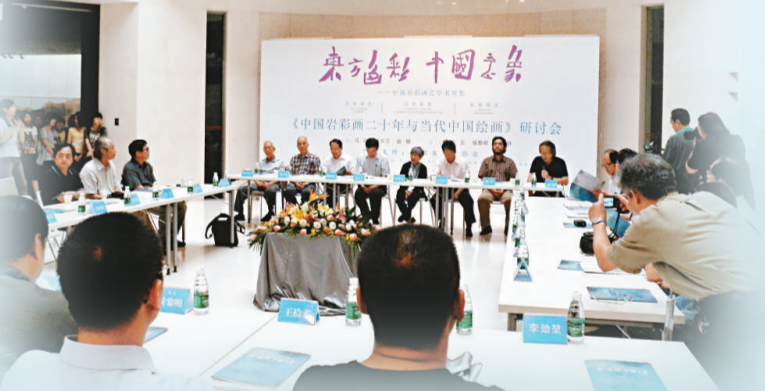
內地創作及研究岩彩畫的專家學者圍繞「中國岩彩畫二十年與當代中國繪畫」的關係進行探討