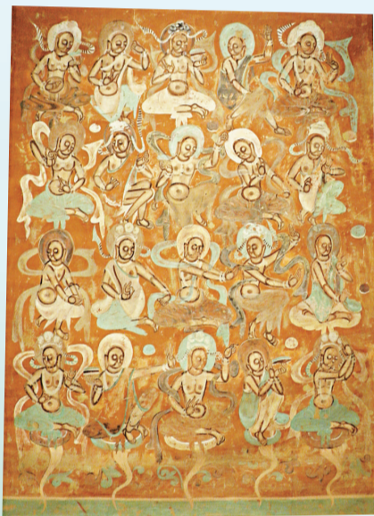
「敦煌循跡」之《供養菩薩》，莫高窟第二二七窟（北涼）