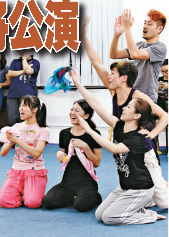
香港戲劇協會將演出喜劇《正在想》，以紀念曹禺誕辰一百周年

馬家戲班的班主老窩瓜，是一個五十歲左右的表演滑稽戲法的老行尊。眼見蹦蹦戲、說大鼓、單口相聲、歌舞團之類的同行們生意興隆，忽然悟出了「要發財，得改行」的道理，決定專演最受歡迎的「話劇」。他連字都不會寫，竟然構思了一部文明話劇，心想：「這幾齣戲，就夠我萬古揚名。」然而，在觀眾眼裡，他卻只是一個既可悲又可笑的「大傻瓜」。