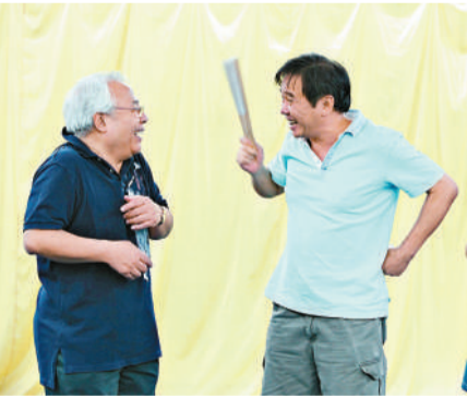
馬家戲班的班主老窩瓜，連字都不會寫，卻構思了一部話劇，希望萬古揚名

【本報訊】今年正值曹禺誕辰一百周年，香港戲劇協會將於本月二十二至二十四日於元朗劇院演藝廳上演曹禺唯一喜劇《正在想》，並由資深舞台導演李銘森執導，全台三十多位演員重新演繹，讓香港觀眾細味曹禺風趣幽默的一面。