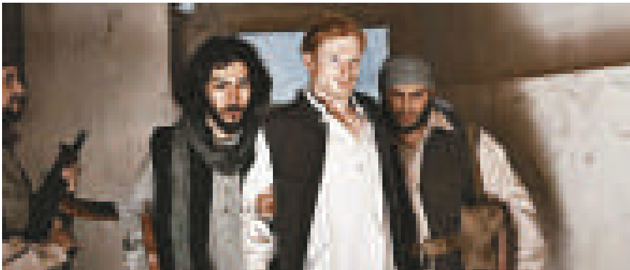
《綁架哈里王子》描述英國王位第三順位繼承人哈里被抓後向武裝分子求饒

英國「第四頻道」（Channel 4）電視台將在10月21日播放受爭議的紀錄片《綁架哈里王子》（The Taking of Prince Harry）。這部影片描述英國王位第三順位繼承人哈里被抓後向武裝分子求饒，內容曝光後，令哈里氣得暴跳如雷。