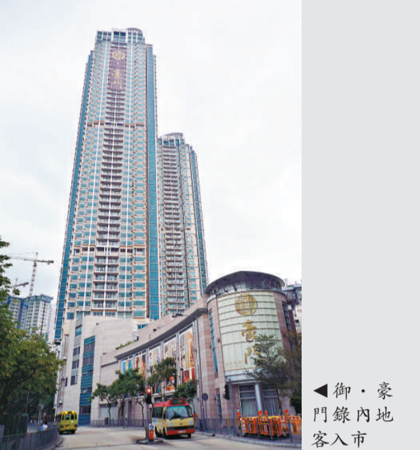
▲御·豪門錄內地客入市