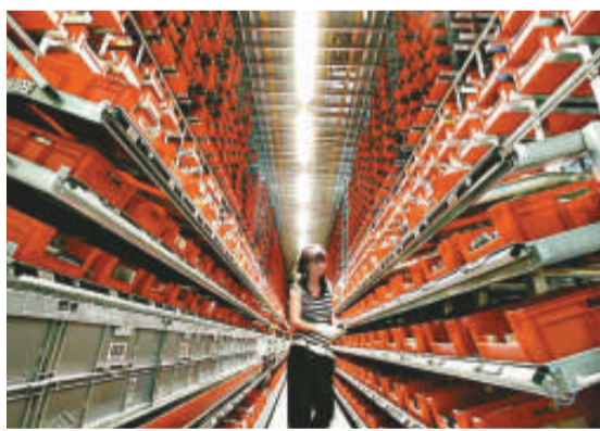
▲來自前「東德」城市哈雷的倉庫工人（中）的調查表明，原東西德之間的經濟差距正在縮小

當愛情開始，當理智、政治說教以及對「東德人」和「西德人」的傳統印象被愛情取代之後，從私人層面上來看，德國的統一變得那樣溫情而現實，它和政治家嘴裡說出的「統一」截然不同！