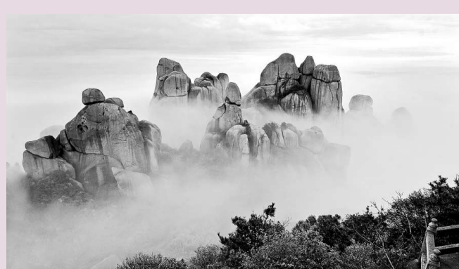
▲位於東海之濱的閩東太姥山，被譽為「海上仙境」。圖為太姥山風光。

寧德地質公園地質遺跡豐富多彩，且類型齊全，有雄偉壯觀的花崗岩山嶽地貌、絢麗多姿的火山岩山嶽地貌、千姿百態的河床侵蝕地貌和海蝕地貌等等，是對民眾進行普及地質科學知識的好課堂。寧德地質公園晉級為世界地質公園，將福建的旅遊產業又推上了一個嶄新的階梯，與泰寧世界地質公園形成互補格局，從而全面推進海西旅遊業平衡發展。