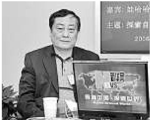
▲65歲的「飲料大王」宗慶后以800億元人民幣資產登上「胡潤富豪榜」榜首。

【本報記者倪巍晨上海十二日電】「胡潤富豪榜」今天揭曉，去年排名榜單第13位的65歲「飲料大王」宗慶后，以800億元人民幣（下同）資產登上榜首，中國醫藥行業巨擘李鍾和和龍紙業的張茵，則分別以400億元和38億元身價位列第二和第三名。