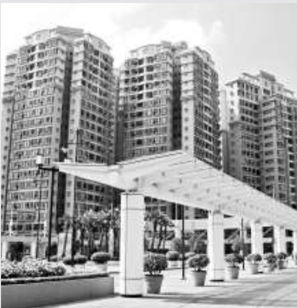
▲建築師學會建議，售賣樓宇應以實用面積計算呎價