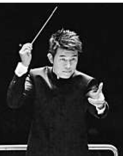
▲中樂團駐團指揮周熙杰將為「鼓王群英會 XIV」執棒