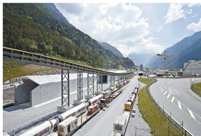
▲攝於2009年5月6日的聖哥達隧道塞德龍隧道口的建設情況 ▼工作人員用巨型鑽土機進行最後1.5米的鑽挖，正式打通聖哥達隧道