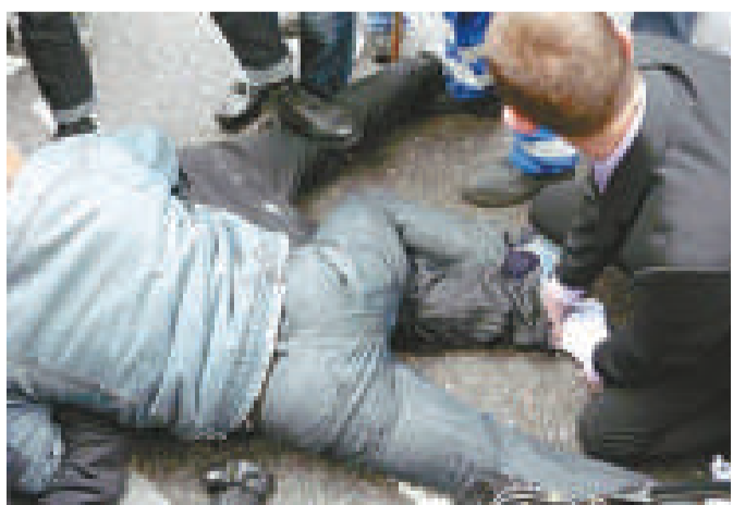
▲一名劫匪被民眾制服在地

【本報訊】據英國《每日郵報》網絡版十五日消息：一群蒙面劫匪星期四在光天化日之下搶劫一家珠寶店。約50名路過群眾與其中一名劫匪展開搏鬥，並將他制服。