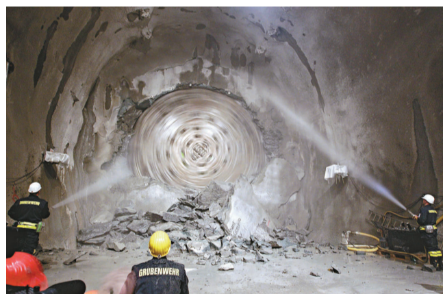
◀瑞士交通部長莫里茨·洛伊恩貝格爾（前排中）與工作人員一起慶祝隧道貫通