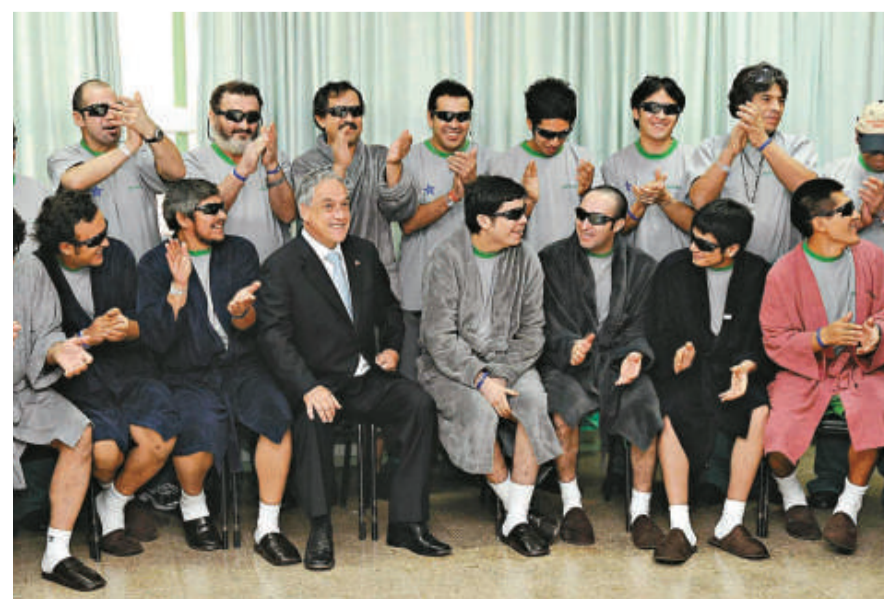
▲智利總統皮涅拉（前排左四）到醫院看望33名礦工，與他們合影