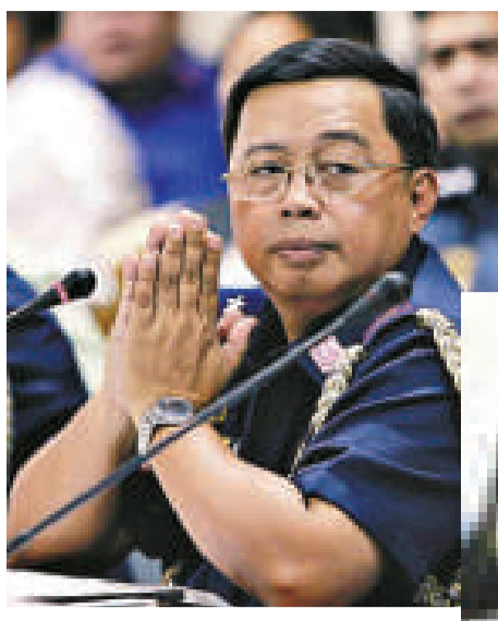
▲馬尼拉前警察署長馬格蒂拜被指「嚴重疏忽職守」需要接受起訴 互聯網 ▶馬尼拉市警局指揮官聖地亞哥因疏忽職守15日被撤職 互聯網