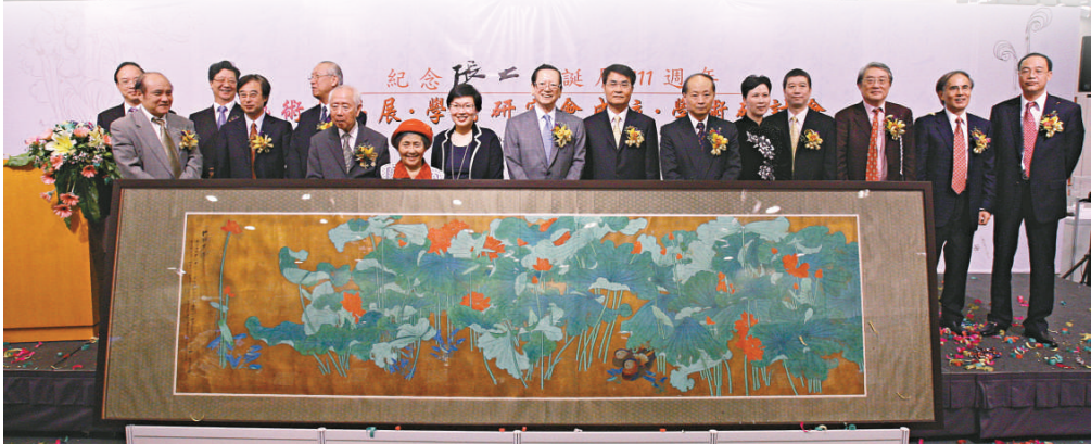
▲主禮嘉賓為張大千首展亮相的名畫《金箔荷花》揭幕

另外，揭幕禮上還選出「張大千學術研究會」和「中國傳統文化學會」成立，為兩岸三地張大千追隨者及歐美藝術收藏家、鑒賞家、文化研究學者，創造一個交流平台。