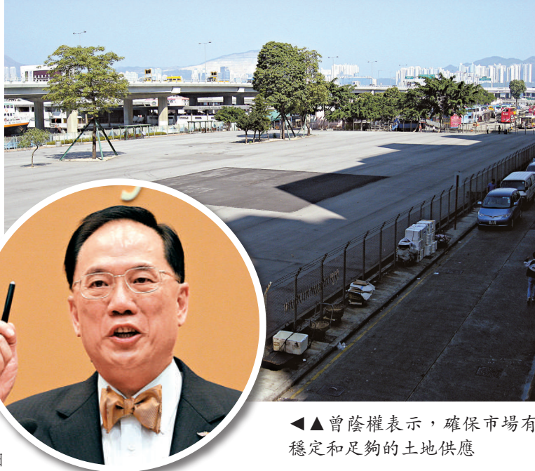
▲▲曾蔭權表示，確保市場有穩定和足夠的土地供應

有居住成分，亦有投資的成分。在房屋問題上，市民的利益並不完全一致，視乎大家身處的位置，政府不宜用激烈的政策措施。「市民話買樓難，其實要做好房屋政策，平衡多元利益一樣難。要安居樂業，我和大家一樣都要迎難而上。」