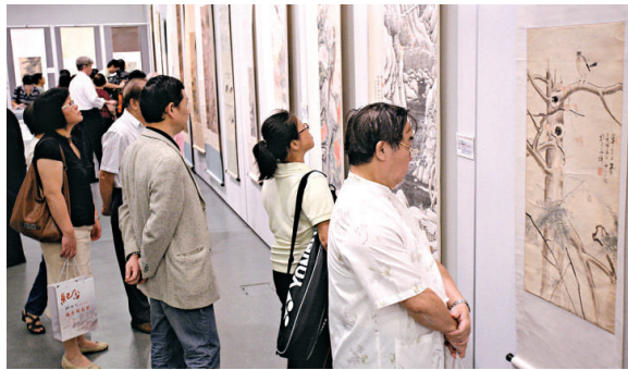
▲觀眾在細心欣賞張大千畫作