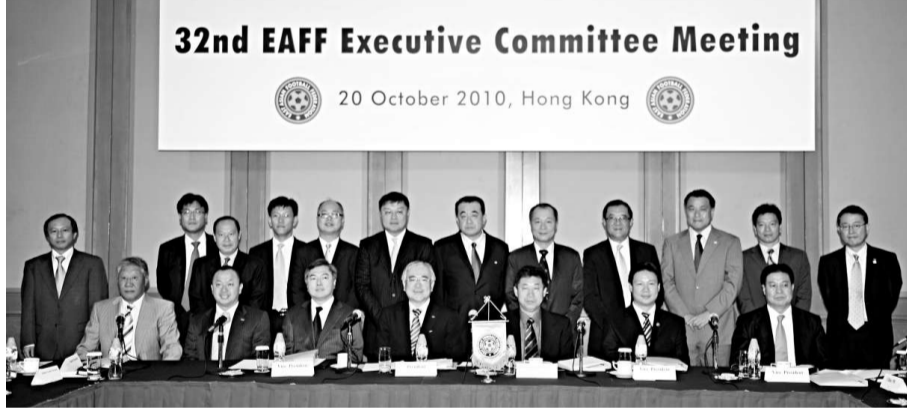
▲東亞足聯第32次執委會會議昨晨在黃埔海逸酒店舉行

【本報訊】據新浪體育二十日消息：北京時間10月20日凌晨，2010年世界體操錦標賽結束了男子預賽，以新老結合陣容出戰的中國隊總體發揮正常，以362.482分獲得預賽團體第一，陳一冰、馮哲和張成龍在吊環、雙槓和單槓比賽中獲得預賽第一，一共有6人次（5人）進入到這3個項目決賽。不太走運的是，另外3項並沒有中國選手進入到8強決賽中。在男子個人全能的較量中，上屆冠軍、日本選手內村航平以92.231分獲得第一，德國選手博伊以90.156分列第2，中國選手呂博以89.639分列第3，賤海濱以89.181分獲得第9。