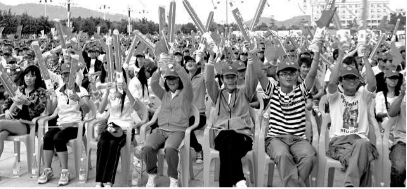
▲作為火炬傳遞的起點和終點，汕尾媽祖文化廣場成為了一片歡樂的海洋