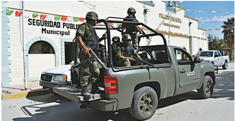
▲墨西哥軍隊在警局外戒備，以防毒販生事