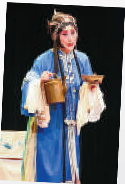
梁谷音飾演趙五娘

是次表演既能展現演員的精湛功力，劇目安排上亦悲喜並重。隨著巡迴演出的展開，引起的回響和觀眾的投入都越見熾熱。理工大學和中文大學的最後兩場不但座無虛席，開場之際尚有大批觀眾在門外等候。於中大舉行的尾場為了不讓觀眾抱憾而歸，等候入場者可席地而坐、或站立於音樂廳座位後，一同感受崑劇的魅力。