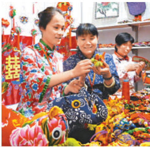
▲文交會上，傳統手工藝品俏銷

南京文化產業交易會自二〇〇六年創辦以來，已經成功舉辦四屆，累計現場交易金額突破四億元（人民幣，下同），意向交易額達二十五億元。文化產業成為南京經濟發展新的增長點。二〇〇九年，江蘇省文化產業增加值突破千億，南京市佔全省近六分之一。