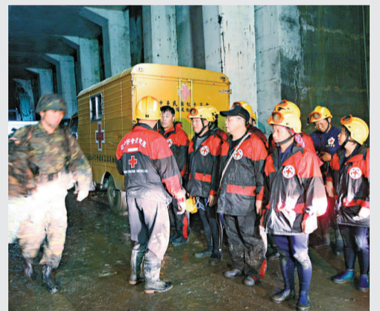
▲ 經過一整天陸空搶救，大部分的遊客已脫困，救難人員及軍人才因天黑、豪雨暫時停止救援任務

台灣領導人馬英九晚間在「行政院長」吳敦義陪同下，赴中央災害應變中心聽取簡報。他對救難人員快速將大部分受困者救援到安全地區給予高度肯定。據了解，經島內軍警與空勤總隊的整日努力，430 人受困，已有 377 人脫困。