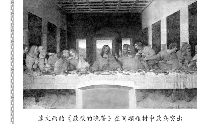
達文西的《最後的晚餐》在同類題材中為最突出

達文西的繪畫 陳天權 達文西留存於世的繪畫並不多，只有十多幅，但每幅都是佳作。當中最廣為人知的，就是收藏於巴黎羅浮宮博物館的《蒙娜麗莎》，和米蘭感恩聖母院教堂牆壁上的《最後的晚餐》。達文西的名畫分布世界不同地方，要全部觀賞並不容易，但現今在香港科學館則可以一次過欣賞其中十五幅的複製品。 達文西的繪畫重視金字塔式布局、透視構圖和人體比例，又精於運用明暗對比的色彩效果，因此創造出來的主題既真實又生動。但達文西一生醉心於科學研究和機械製造，花在繪畫的時間不多，有些作品要由助手幫助完成(如《岩間聖母》)，有些一直未作最後加工(如《三博士來朝》)，但不減其藝術地位。 在香港科學館的「達文西的創意奇想」展覽，按先後次序展示了達文西十五幅作品。第一幅由他個人創作的繪畫是《聖母領報》，講述天使加百利告知瑪利亞即將懷孕的聖母故事。那天使的翅膀如同飛鳥，可見達文西把飛行研究的興趣應用在繪畫之上。在《最後的晚餐》一畫，耶穌位於畫面中心，即透視線的焦點，因此最受矚目。另一個重要人物是猶大，但達文西將他混在眾多門徒之中，並不突出他。當門徒得知有人出賣耶穌時，都表現出驚愕神色，唯獨猶大的臉孔黑暗模糊，看不清表情，其身體往後退，左手有所動作，成為了這幅畫的一個欣賞點。