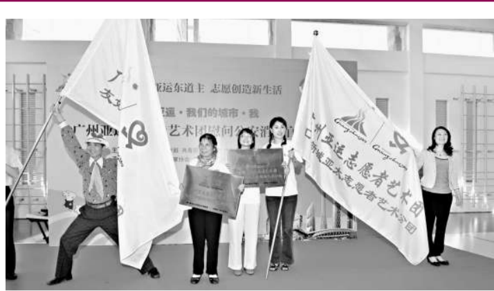
▲亞組委志願者部正式向民間藝術團廣州市友好鄰里志願者藝術中心和社區藝術團匯景新城亞太志願者藝術團授牌和旗幟