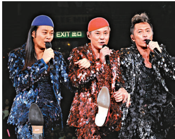
▲草蜢三子的友情歷經考驗，已到百毒不侵之境

相隔半年再會歌迷，情緒高漲的阿傑大呼草蜢很愛歌迷，又感謝他們對自己不離不棄，阿智坦言尤其擔心之前的颱風，幸好最後也被歌迷的熱情叫它轉彎