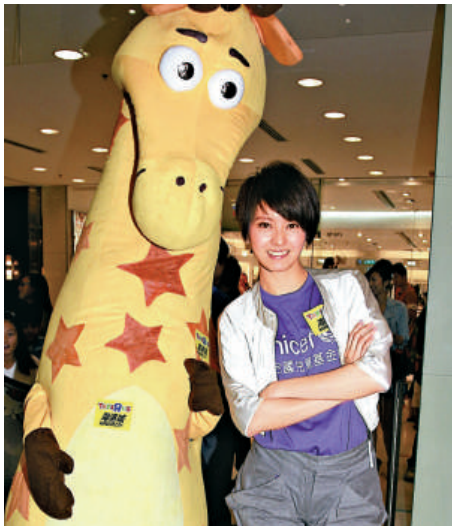
▲梁詠琪希望 Selina 盡快康復

另外，日本女優蒼井空早前來港協助宣傳新片《復仇者之死》，但不幸生病入院，令戲中拍檔 Juno 十分擔心。Juno 透露對方患上胃炎，可能因每天工作十五小時，行程緊密導致身體出現問題，不過下月尾她會再來港出席首映，他已叮囑電影公司屆時要安排多些時間給她休息。