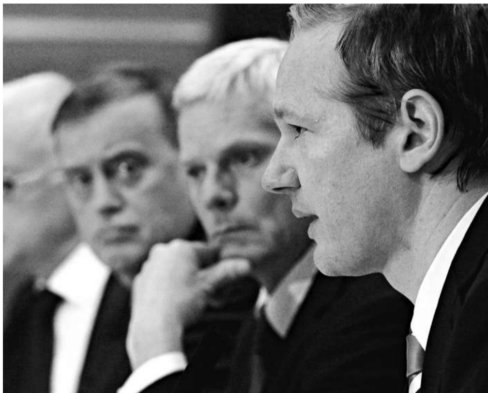
▲「維基解密」創始人阿桑奇(右)與其同事23日在倫敦召開記者會

律師們說，這些報告有可能把英、美部隊捲入據說存在的虐待及法外殺戮文化中。與「維基解密」創辦人阿桑奇一起在倫敦記者會上露面的律師夏納說，有些人的死因可能與英軍有關，現在有可能交由英國法庭處理。