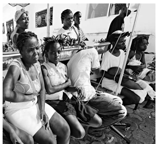
▲感染上霍亂病菌的海地民眾在醫院等待治療

【本報訊】綜合通訊社太子港二十五日消息：加勒比島國海地霍亂疫情死亡人數不斷增加。衛生當局說，已有253人因霍亂死亡，有超過3000人感染上霍亂病菌，但24日新增病例有所減少。與此同時，科學家說，海地仍可能再次發生7級甚至更大的強震。