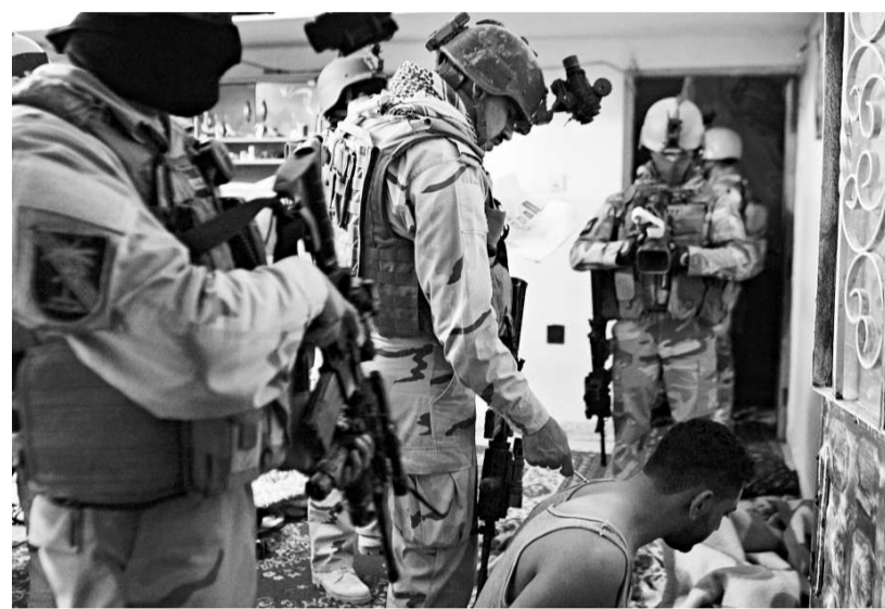
▲「維基解密」網站公布的美軍審訊伊拉克囚犯的圖片

無論真相如何，科學家指出，根據觀測與計算機模型仿真，1月的地震並未將EPGZ表面累積將近兩個半世紀的能量完全釋放，EPGZ對海地仍是嚴重的地震威脅，尤其是首都太子港地區。