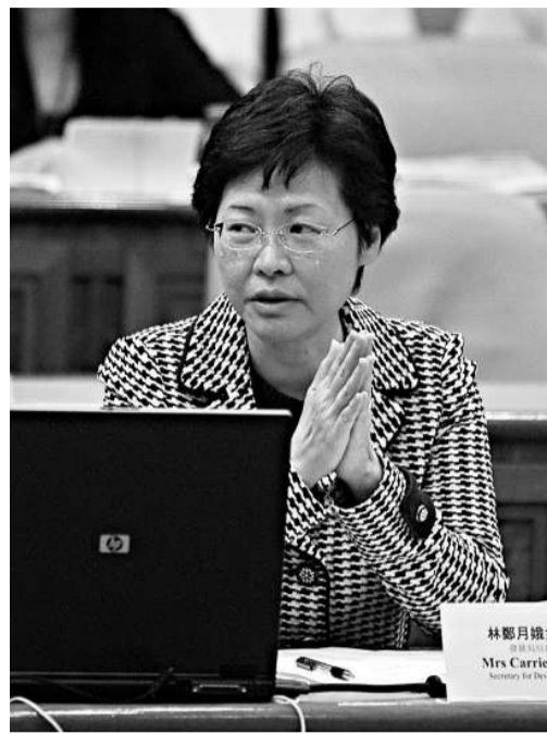
▲林鄭月娥昨回應議員質詢

議員李永達說，市區重建項目Queen's Cube呎價達一萬五千元，他抨擊市建局「割得太盡」。林鄭月娥承認：「項目予人印象不好，是觀感有問題，」但市建局與發展商簽定合約，只能按市場機制做。她說：「發展商今次開價進取，面對風險，社會廣泛評論，相信亦上啖一堂。」