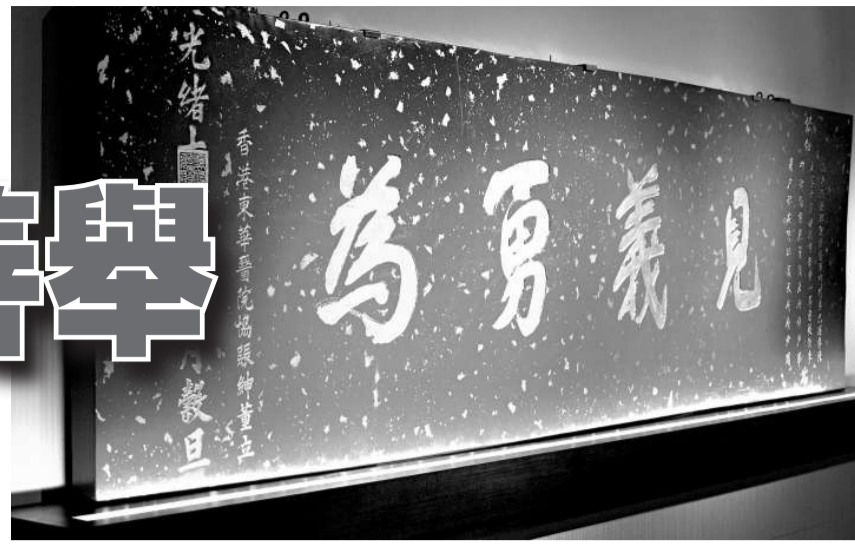
光緒十年（1884年）李鴻章聯同三位官員贈予東華的「見義勇為」牌匾。

該展覽即日起至明年一月十七日在香港歷史博物館專題展覽廳舉行，詳情可瀏覽網址： http://hk.history.museum 。