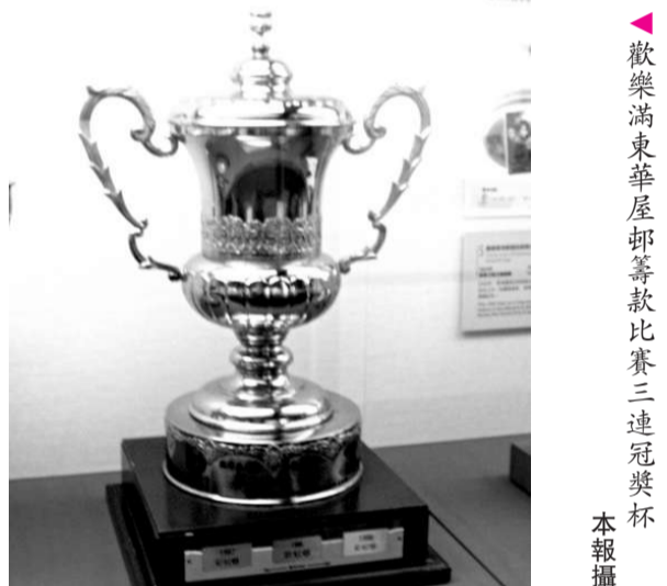
歡樂滿東華屋邨籌款比賽三連冠獎杯。