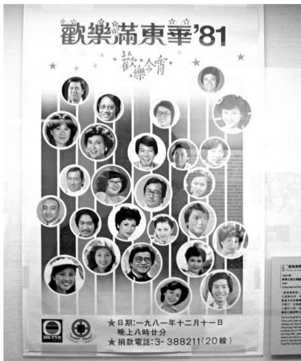
一九八一年的「歡樂滿東華」宣傳海報。