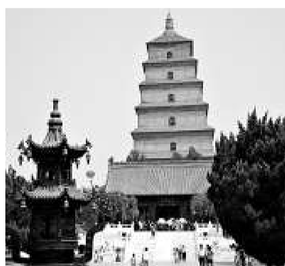
▲明顯看出傾斜的大雁塔正在被逐漸「扶正」

被視為古都西安象徵的大雁塔建於唐代永徽三年（公元652年），最早在清朝康熙年間就有了對大雁塔傾斜的準確測定。到1941年，測定大雁塔已傾向北傾斜了413毫米。由於地下水的超採，從1945年起大雁塔的傾斜速度開始加快，1985年至1996年，它更是以每年1毫米的速度向西北方向傾斜，到1996年，其塔端傾斜位已達到1010.5毫米。