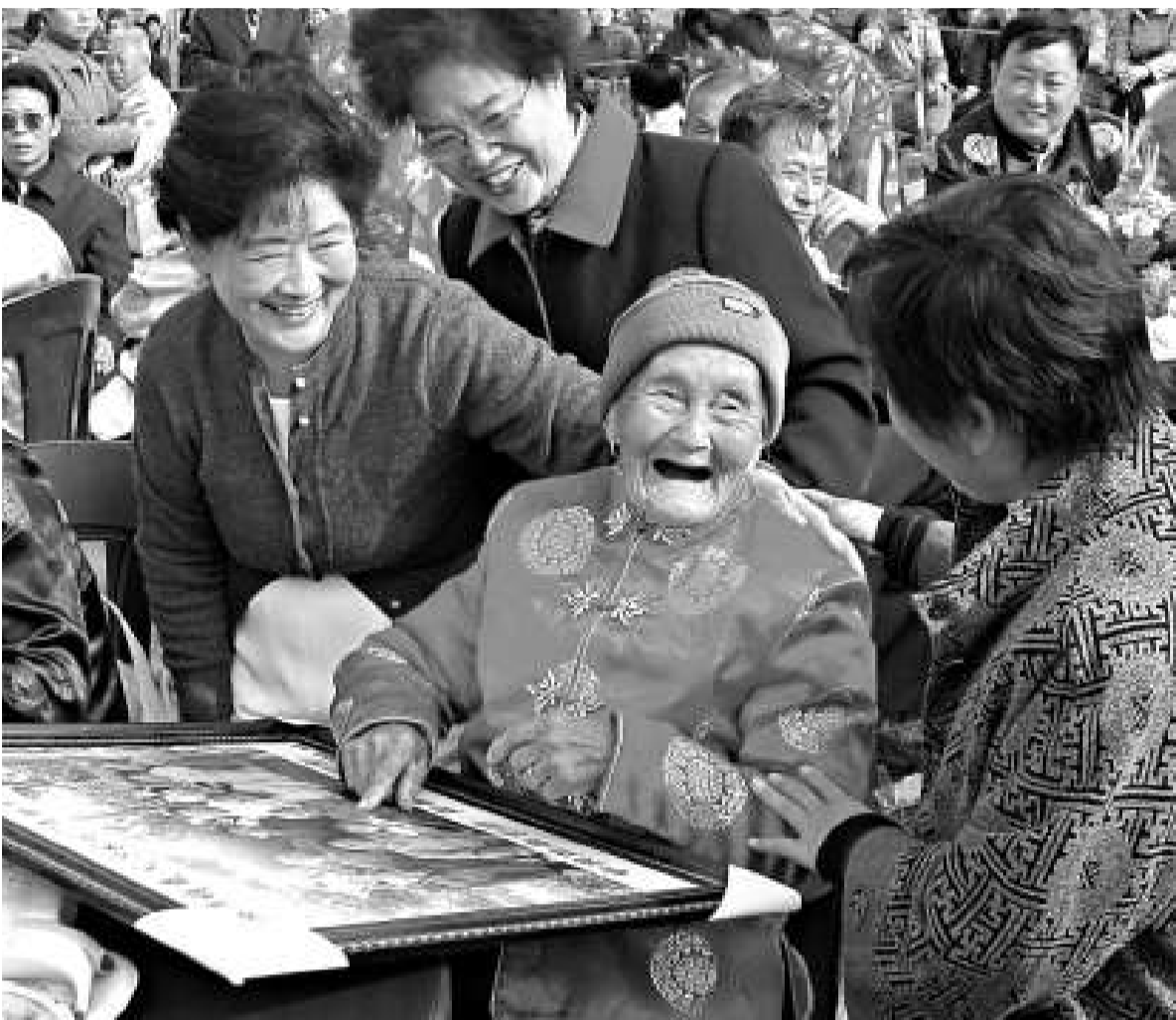
▲江蘇如皋為著名長壽之鄉，圖為百歲老人為政府舉辦的活動撐場

數不是在高寒地帶，就是在偏僻地區，唯有如皋地處人口稠密、工業發達的平原地帶。目前，如皋市有2400多名95歲以上、7400多名90歲以上和五萬多名80歲以上的壽星。