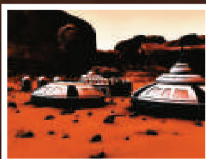
被派往火星的太空人將定居火星想像圖