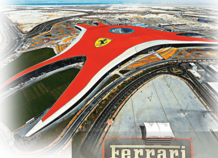
法拉利跑車為主題的主題公園將於下周開幕

就在亞斯島對出，當局斥資270億美元在薩迪亞特島興建一個文娛藝術區，景點包括分別仿照巴黎羅浮宮和紐約古根漢博物館的博物館。(英國《每日郵報》)