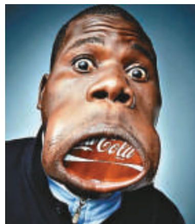
若阿金的嘴巴能夠「含住」一罐可樂