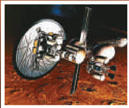
負責登陸火星的載人飛船「百年星艦」想像圖

當然，這樣的計劃會引起相關的道德爭議，人們會覺得把那些太空人留在火星等於遺棄了他們，任其自生自滅。但科學家呼籲人類重拾「哥倫布精神」，並形容首批火星居民其實是與哥倫布等探險家一樣的先驅者，哥倫布等人為了到達新大陸踏上前途未卜的旅程，深知自己以後再也無法回家，甚至可能為此失去生命，這需要極大的探索精神和冒險精神。