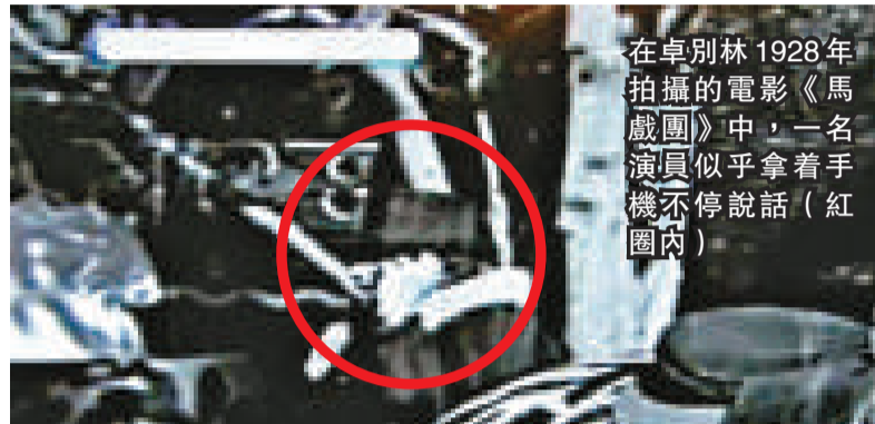
在卓別林1928年拍攝的電影《馬戲團》中，一名演員似乎拿著手機不停說話(紅圈內)