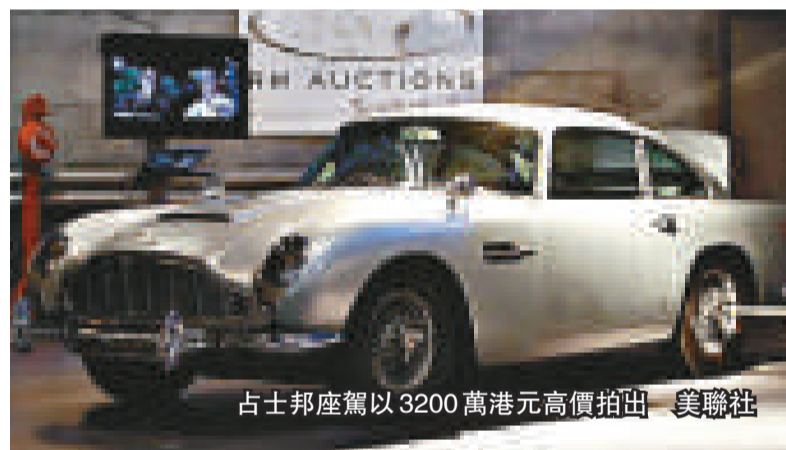
占士邦座駕以3200萬港元高價拍出