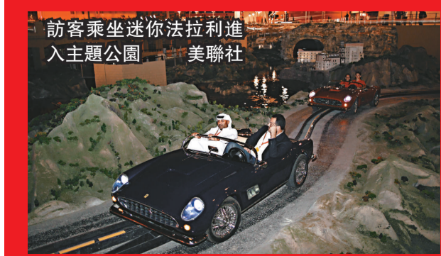
訪客乘坐迷你法拉利進入主題公園