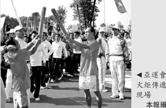
◀亞運會火炬傳遞現場

在港人火炬手中，不少是知名人士，如霍英東集團行政總裁霍震寰、香港工聯會理事長黃國健、金利來集團有限公司副主席兼行政總裁曾智明、霍英東集團副總裁霍啓剛等，還有演藝界的紅星，包括譚詠麟、曾志偉、古巨基等，其中霍震寰、譚詠麟、曾志偉將於十一月初在廣州火炬傳遞。