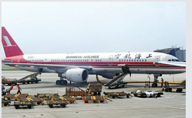
▲上海航空公司的客機降落在廣州白雲機場。東航旗下的上海航空公司爲保持新東航戰略的一致性，根據此前與星空聯盟達成的共識，於2010年10月31日正式退出星空聯盟，隨同東航加入天合聯盟

由月底起，天津機場將執行2010年冬季至明年春季航班計劃，機場的航線及航班時刻與夏秋季相比有所調整。客運方面，奧凱航空將開天津至包頭的定期往返航線，機型爲737-800飛機，班期爲每周1、3、5、日。天津航空從11月16日開始將開通天津經停呼和浩特至烏蘭巴托的定期往返航線，班期爲每周2、6。上海航空、國航分別增開天津—西安—天津和天津—三亞—天津航線，每周7班。