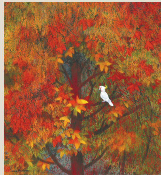
▲郁風作品《山中精靈》