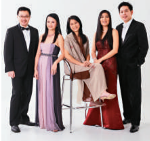
▲美聲曲藝社將在「秋之戀曲」音樂會中獻唱經典情歌