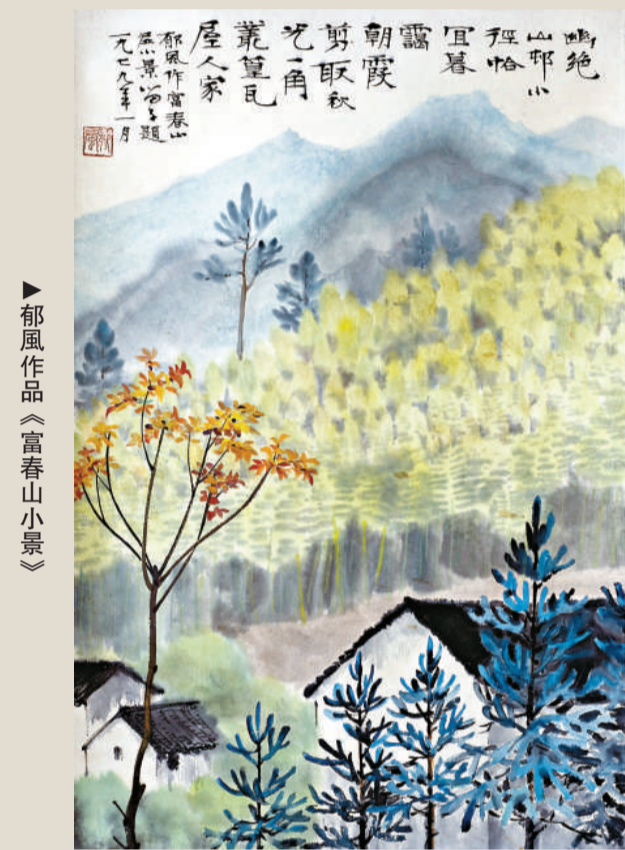
▶郁風作品《富春山小景》