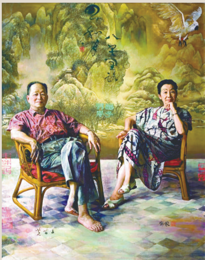
▲沈嘉蔚作品《苗子郁風》