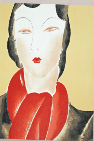
▶郁風作品《白屋人家》