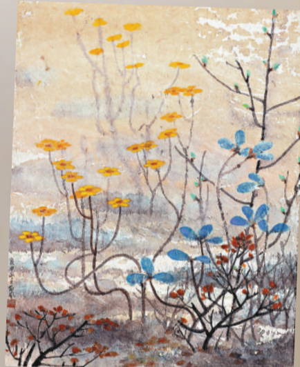
▲郁風作品《春風吹又生》