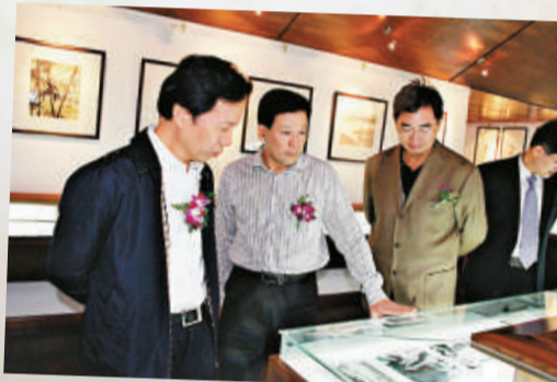
▲文化部副部長王文章（左一）、富陽市政協主席胡志堅（左二）參觀郁風苗子紀念館