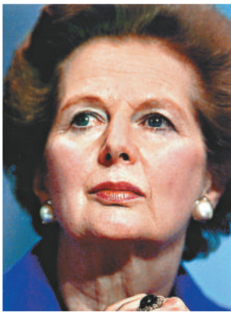
▲英國前首相戴卓爾夫人被視為最有影響力的女性