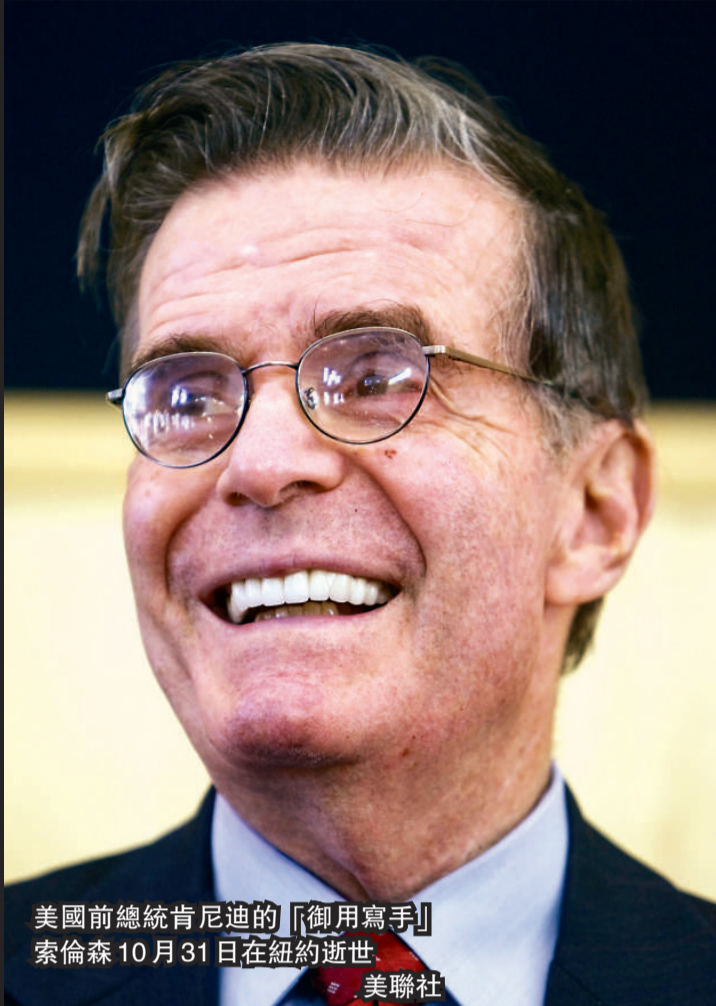
美國前總統肯尼迪的「御用寫手」索倫森10月31日在紐約逝世。