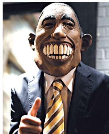
▲奧巴馬成為萬聖節被模仿對象