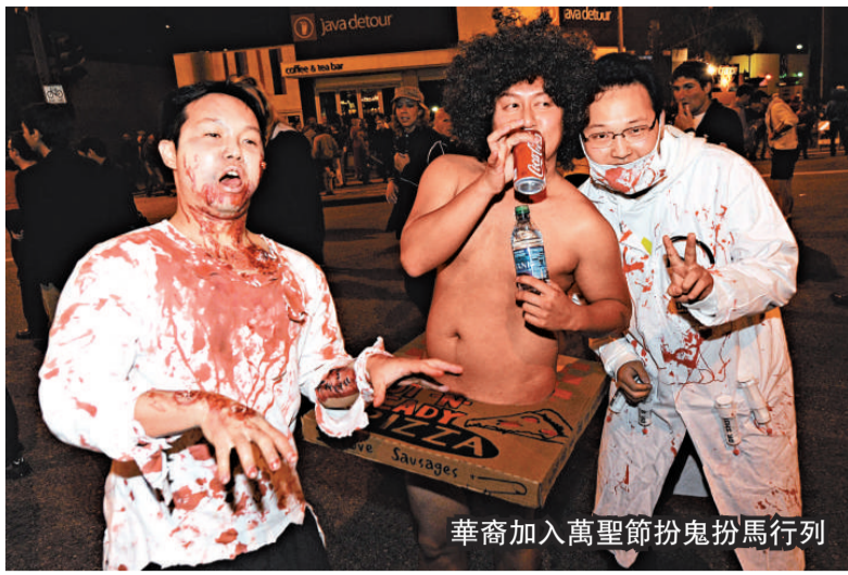
華裔加入萬聖節扮鬼扮馬行列