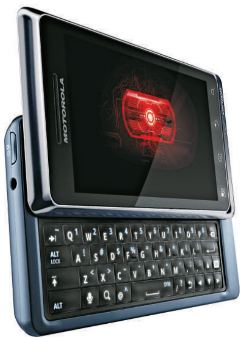
▲摩托羅拉的Droid手機被指侵犯蘋果的觸屏技術

摩托羅拉在2006年因為他們的Razr掀蓋式手機熱賣，成為全球第二大手機製造商，但是當智能手機日漸普及後，他們就被其他同業超越。