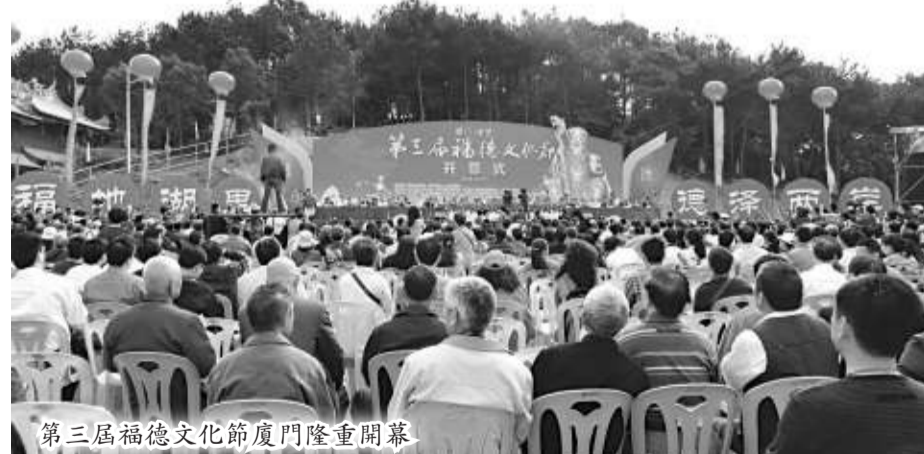
第三屆福德文化節廈門隆重開幕

土地公民間信仰是閩台兩岸民間最為廣泛的習俗,僅台灣一地就有土地公廟1300多座。廈門仙岳山福德正神土地公廟始建於宋代,香火鼎盛,是目前福建乃至兩岸最大的木結構土地公廟。(林淨容)