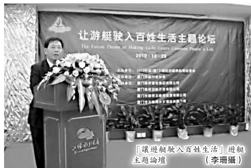
「讓遊艇駛入百姓生活」遊艇主題論壇

由2010中國(廈門)國際遊艇帆船展覽會組委會主辦,廈門遊艇行業協會承辦的2010中國「讓遊艇駛入百姓生活」主題論壇於10月29日下午在廈門五緣水鄉酒店舉行。