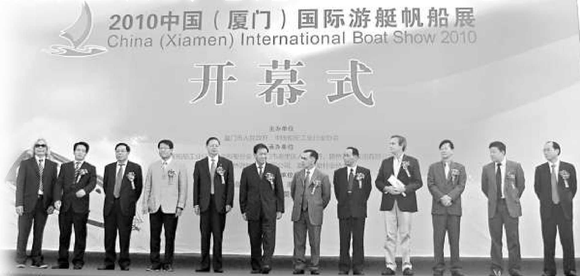
▶ 2010中國(廈門)國際遊艇帆船展開幕式