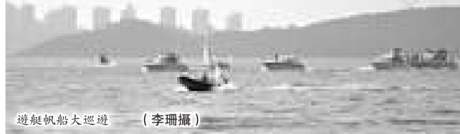
遊艇帆船大巡遊