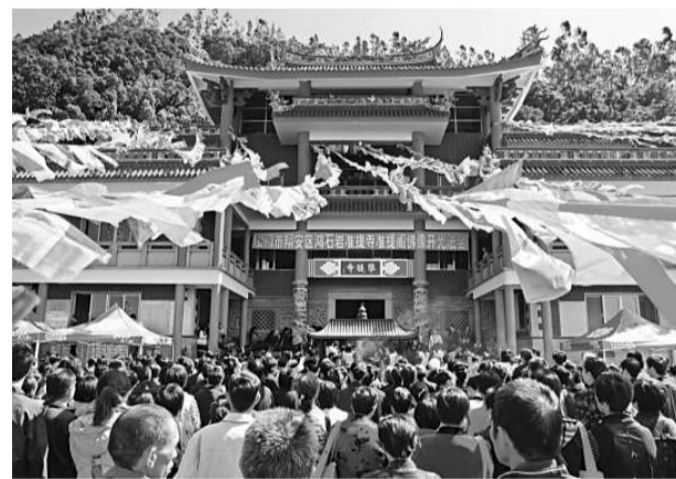
翔安准提寺准提閣舉行佛像開光法會

10月28日上午,廈門市翔安區鴻石岩准提寺准提閣舉行隆重的佛像開光法會,來自台灣、北京、青海、浙江、四川、甘肅、江蘇、廣東及福建等地的諸山長老及廣大信眾齊聚翔安准提寺,共襄盛舉。