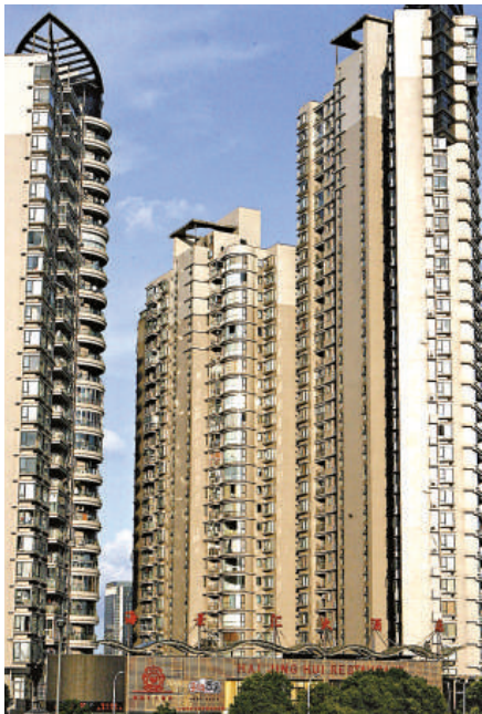
▲上海新房近期成交量下降三成五。這是上海市魯班路附近一新建小區樓盤

據網易報道，此前北京、廣州、上海、天津等地在實施細則中已經收緊了公積金貸款，內容基本都是首套房90平方米以上的首付為三成，90平方米以下的首付為二成；第二套貸款比例為五成；取消第三套房貸款。上海還規定，對於改善居住條件購買第二套住房的，每戶家庭住房公積金最高貸款限額由之前的60萬元下降到40萬元。