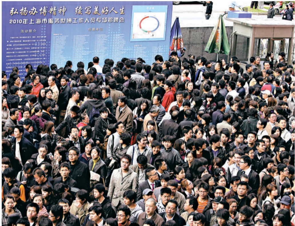
▲招聘會吸引了25000名應聘者，現場異常火爆

上海世博會獲得巨大成功，與數萬園區工作人員和義工的服務是分不開的。世博會結束後，這些工作人員面臨轉崗再就業。今日此間舉行首場「世博服務人員招聘會」，逾300家企業帶來6000多個職位進場招聘，吸引了25000餘名曾在世博園服務的搵工者，場面火爆。