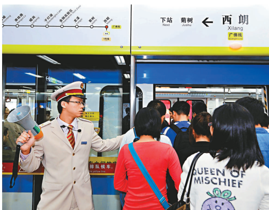
▲工作人員在廣佛線西朗站引導乘客上車

【本報記者黃裕勇廣州三日電】國內第一條全地下的城際軌道交通線、珠三角首條城際快速軌道交通廣州至佛山段首通段3日投入使用，標誌著珠三角進入全面城軌化。