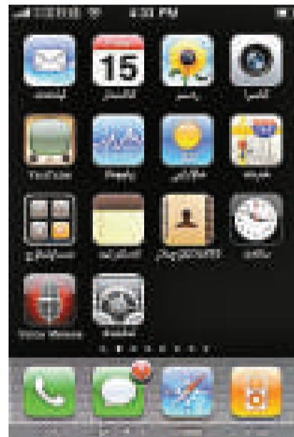
▲iPhone系統維文本地化介面

據悉，該公司是一家主營軟件開發、製作與研究三維數字媒體科技，擁有自主知識產權的IT技術企業。他們專門針對新疆用戶推出了蘋果系統上的維吾爾文輸入法、維吾爾文校對系統、維吾爾一漢一英雙向詞典、維吾爾文編輯等多項軟件，極大地方便了新疆地區少數民族群衆通訊方面的查詢與交流。