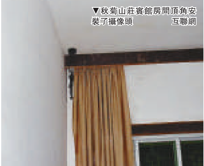
▼秋菊山莊賓館房間頂角安裝了攝像頭 互聯網