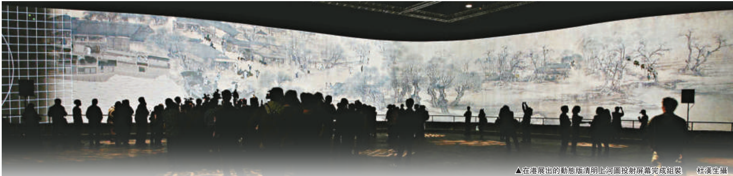
▲在港展出的動態版清明上河圖投影屏幕完成組裝