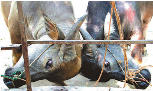
▲鬥牛是「牛墟風情節」重要內容

【本報訊】記者黃仰鵬東莞報道：東莞橫瀝鎮將於本月六日至八日舉辦首屆「百年牛墟風情節」，國際鬥牛舞大賽、牛彩繪等十個「牛文化」主題特色活動輪番上演，向外界展示百年牛墟古鎮從農耕文明到工業文明再到現代文明的歷史變遷進程。