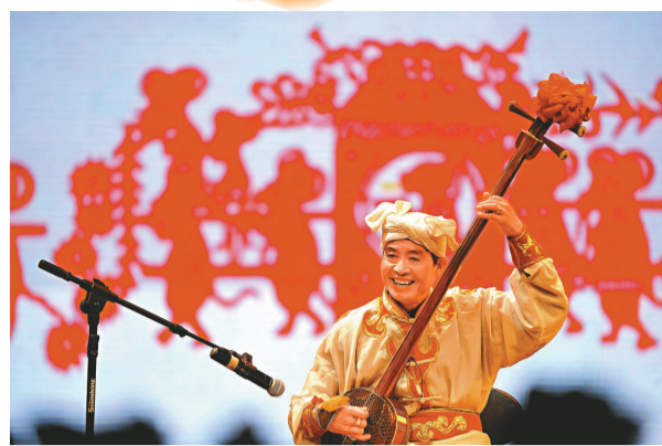
▲陝西榆林民間藝人表演陝北說書