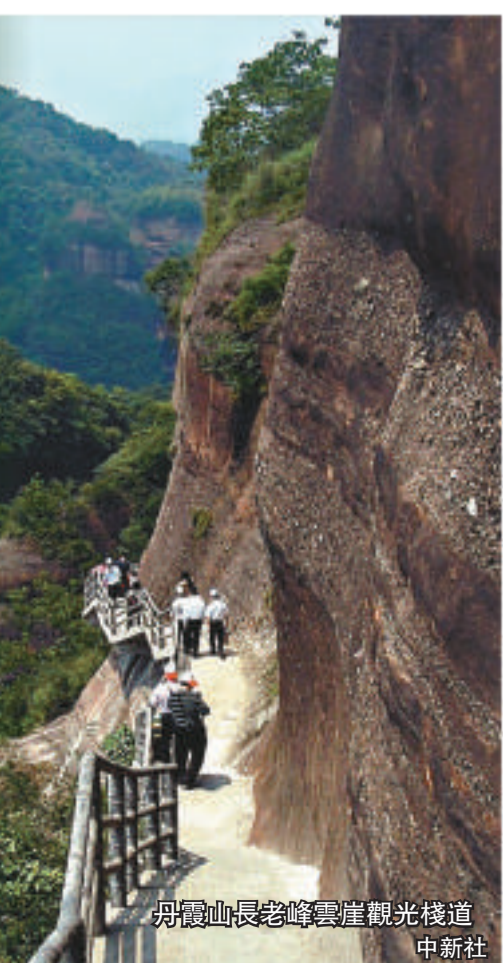
丹霞山長老峰雲崖觀光棧道

從廣州天河出發，上華南快速幹線，經北二環、太和立交進入京珠高速，至韶關南站下高速（車程約2.5小時）。