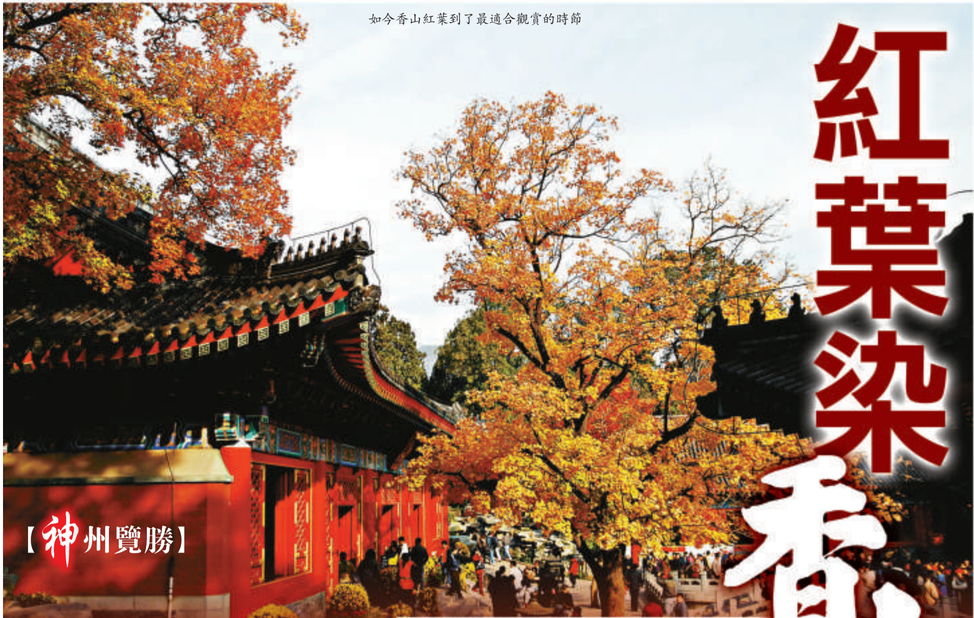
如今香山紅葉到了最適合觀賞的時節