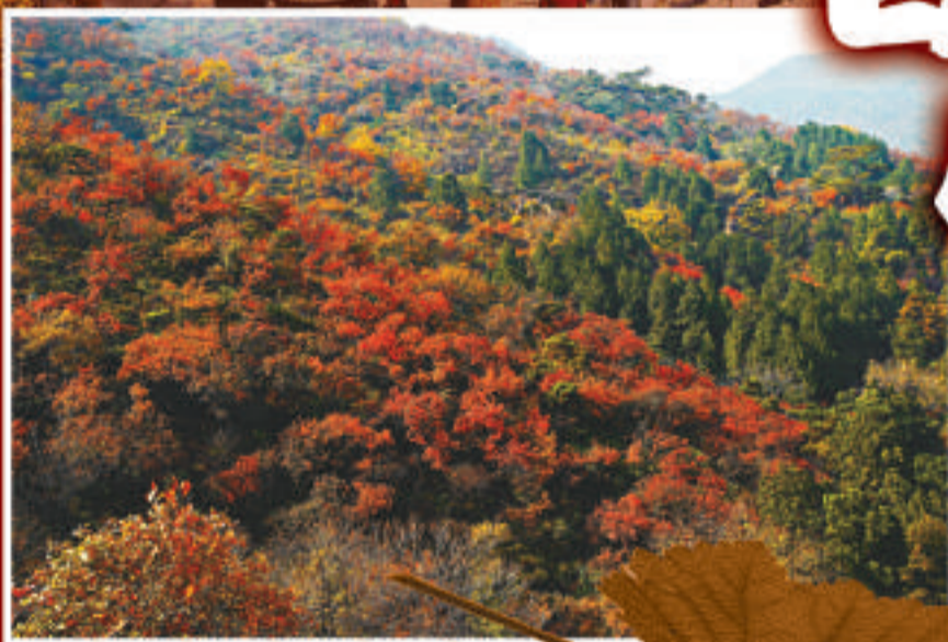
▲今秋香山的紅葉變色比往年早

乾隆時期香山大興土木，規模更為宏大，乾隆十年定名「靜宜園」，位列清朝「三山五園」。黃槿就是乾隆年間栽種的。有資料稱紅葉為關外常見之物，在寬甸、本溪等八旗先人的聚居地都有大片的紅葉林區，相傳乾隆在香山廣植紅葉類植物，有追念先人、不忘根本之意。但因為關外的紅葉多為楓樹，關內種植者不太熟悉其習性，因此改種黃槿。兩百多年過後，黃槿成為香山主要樹種，共10萬餘株。此外，香山紅葉還有其他樹種，如五角楓、三角楓、雞爪槭、柿樹、火炬樹、烏桕等。香山紅葉樹共約14萬株，種植面積約1400畝。每到秋染香山之時，萬山紅遍，層林盡染，如火如荼，極為壯美。