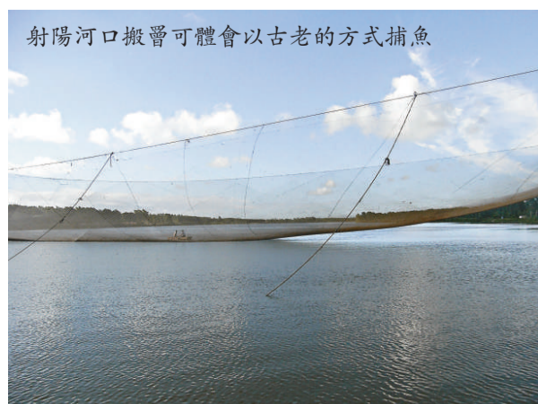
射陽河口搬罾可體會以古老的方式捕魚

不過，正是由於搬罾捕魚的不可控性與不確定性，才增加了無限的樂趣。起網時，我們竟有點微微的緊張，內心滿是期待，眼睛緊盯著緩緩升起的網等等，快樂地享受著搬罾捕魚過程中的每一個細節帶來的新奇體驗。