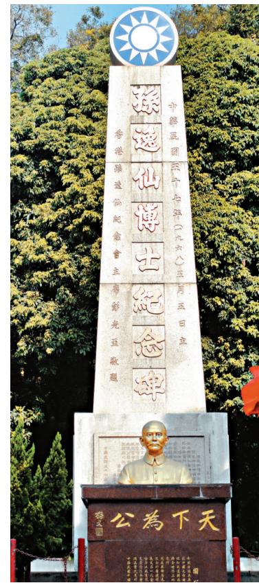
位於屯門的中山公園，俗稱紅樓