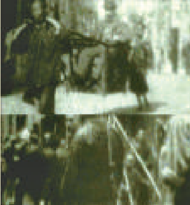
1898年拍攝的《香港街景》畫面

至於最早在香港放映電影的人，是美國電影發行商麥頓。由於當時尚未有專供放映電影的戲院，很多時只是在中環近海的空地搭建簡單布棚，放幾行椅子，再在木箱