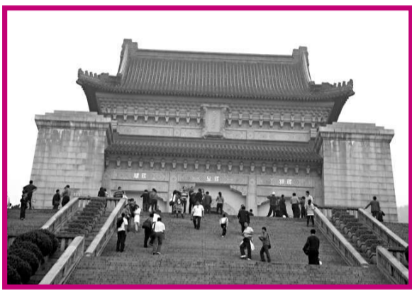
▲南京中山陵陵寢後天（12日）起免費開放。圖為中山陵祭堂外觀