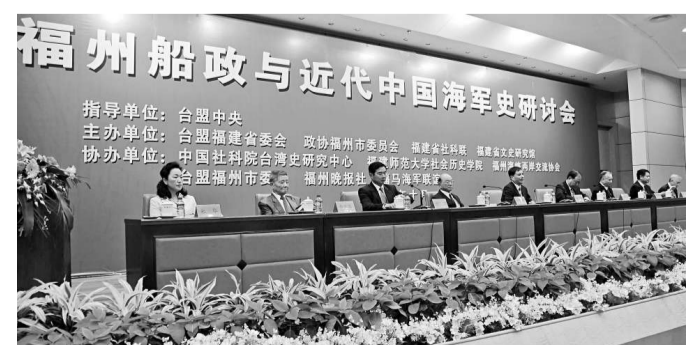
▲「福州船政與中國近代海軍史」研討會日前在福州舉行。圖中主席台左起為：福州市委常委、副市長、宣傳部長朱華，前台灣海軍中將鄭本基，福州市政協主席陳揚富，前台灣海軍總司令、二級上將葉昌桐，台盟中央副主席楊健，福建省政協副主席葉家松，台灣中華黃埔同學會會長、前陸軍滿星上將進行健等