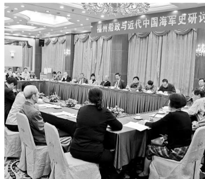
▲兩岸船政精英及後人與專家學者濟濟一堂，共同弘揚船政精神

研討會上，當船政後人提出兩岸共同研究出版船政誌書、為民國海軍總司令陳紹寬將軍塑銅像等建議時，鄭本基第一個鼓掌贊同。他說：陳紹寬將軍是船政先賢，也是我們海校的老校長，在抗戰最艱難的歲月裡，為中國海軍的發展壯大作出了卓越的貢獻。當年在貴州桐梓海校，我們的校訓就是：「甲午午恥」，「把我們的最前線壓到敵人的海岸線」，這些至今都是兩岸中國海軍的精神傳承。