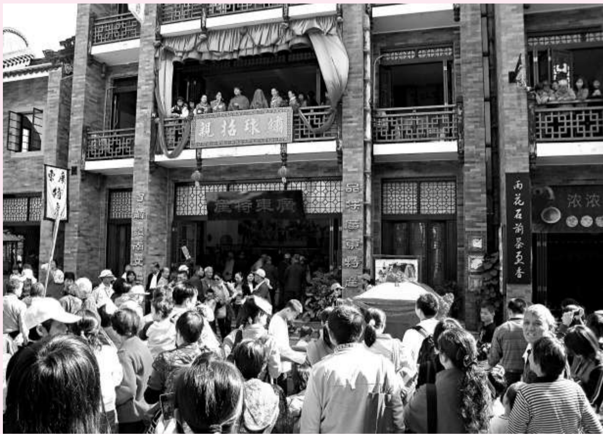
▲廣州別具嶺南特色的「繡球招親」表演吸引眾多遊客駐足觀看

王鵬善透露，中山陵園管理局將在2011年辛亥革命100周年之前，籌建孫中山奉安紀念館，主要展出中山陵遺址、建設以及奉安大典的諸多珍貴史料，紀念館建成後也將免費對外開放。