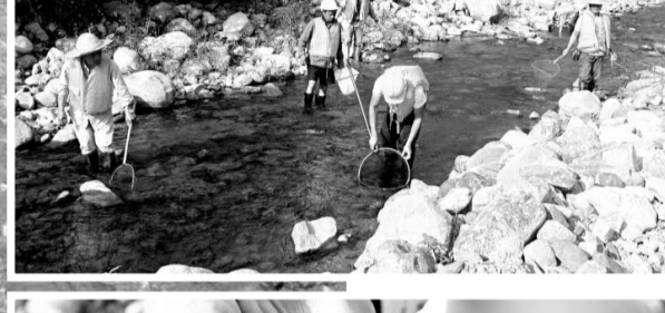
在林村河捕得的蝶螈（即蠑螈）