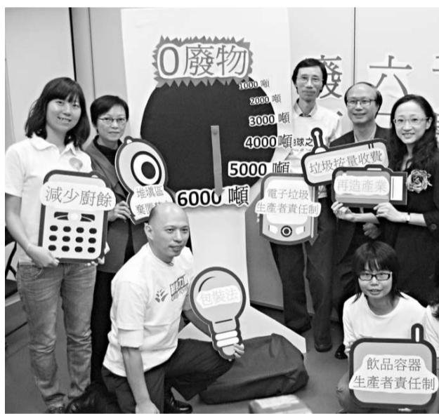
多個環保團體聯署提出以減廢為主導的全面資源管理策略

【本報訊】香港未來如何減少廢物？有環團及團體發表聯署，要求政府在二〇一二年任期完結前，推出生產者責任制、廢物收費、全面回收廚餘及堆填區棄置令等法案，預計二〇二二年前，可令每日棄置約九千噸的都市固體廢物，大幅減少達六千噸。團體本週五將舉行峰會，就此作討論。