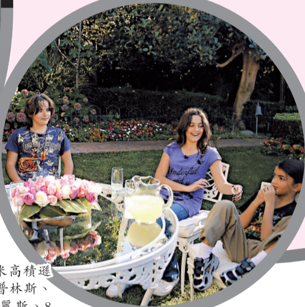
►（左起）米高積遜13歲的兒子普林斯、12歲女兒帕麗斯、8歲兒子布蘭克