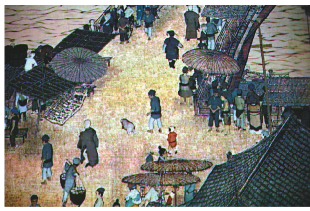
▲▼《上河圖》日夜效果呈現觀眾眼前