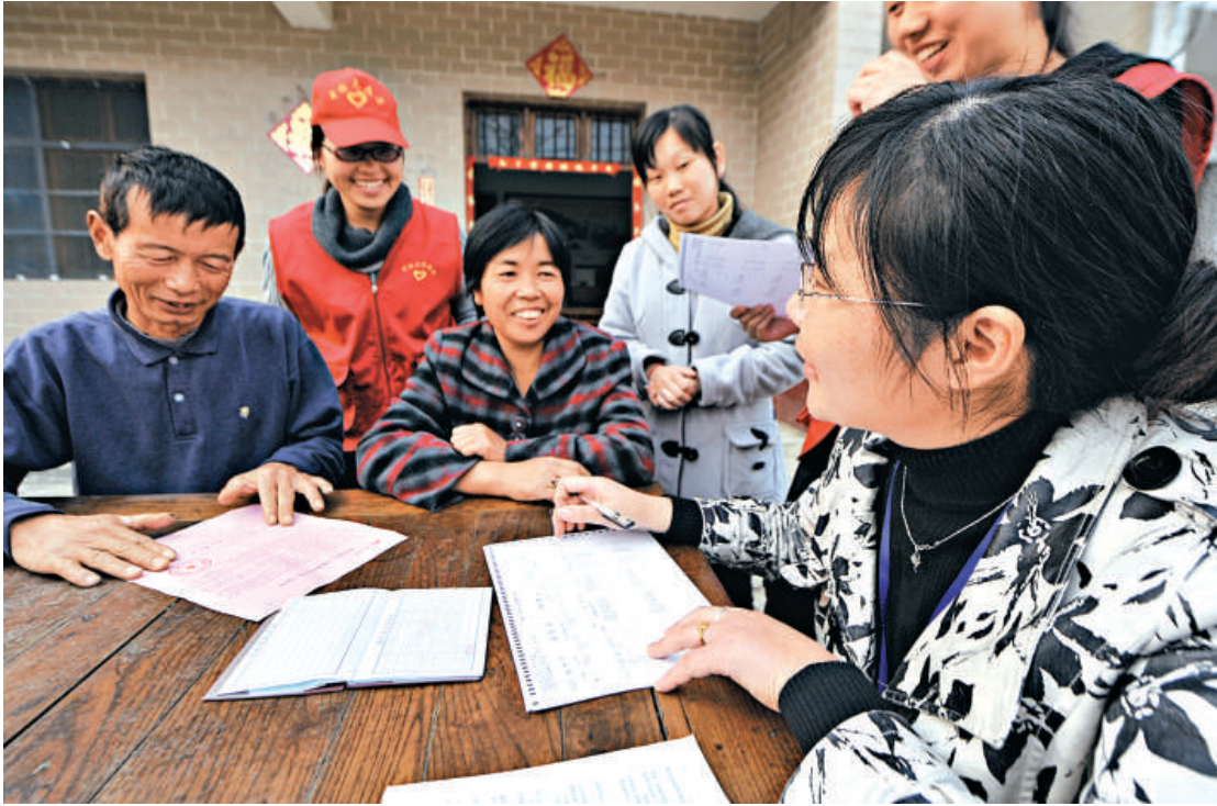
▲中央安排逾80億元用於是次人口普查，但成效仍要看基層執行如何