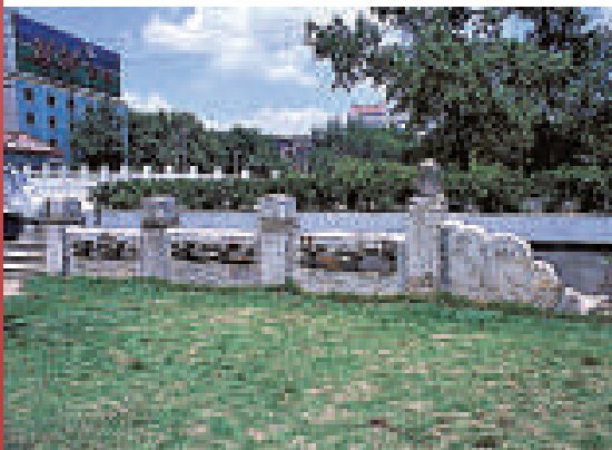
▲南京明故宮西安門外玄津橋遺址 資料圖片