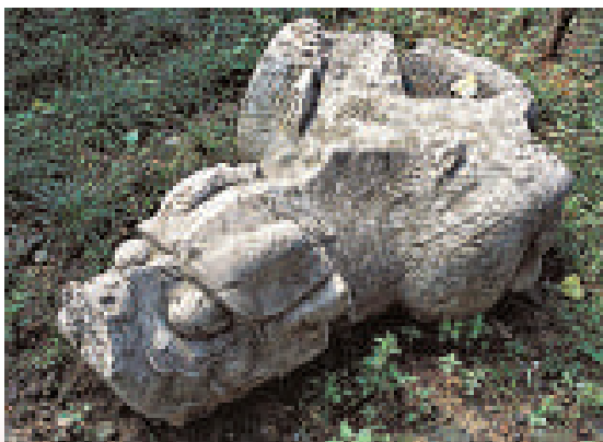
▲南京明故宮散落石瑞首