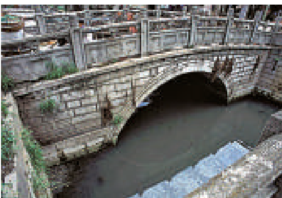
▲南京明故宮外金水橋遺址 資料圖片