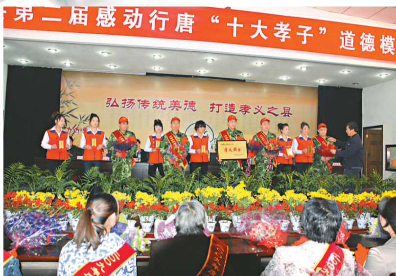
行唐縣評選「十大孝子」模範