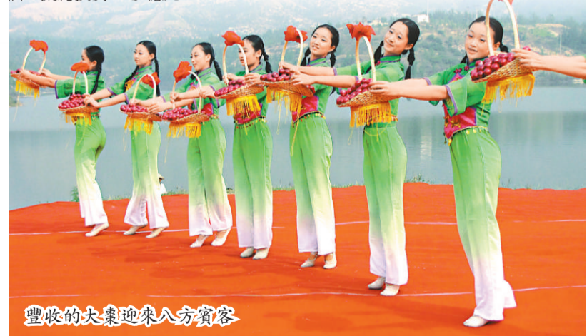
豐收的大棗迎來八方賓客

項目建設進入了「建設一批、跑辦一批、謀劃一批」的良性軌道。2009年上半年，有玉晶玻璃、華牧海蘭蛋雞產業化基地、明旺A3利樂包生產線及物流倉庫等8個重點建設項目，總投資56.75億元；重點跑辦項目有華浩煤炭物流交易中心項目、生態氣工程項目、大棗深加工項目等8個，預計總投資40.3億元；謀劃項目有工業園區開發、城區集中供熱、縣城路網改造升級項目等18個，擬總投資40多億元。