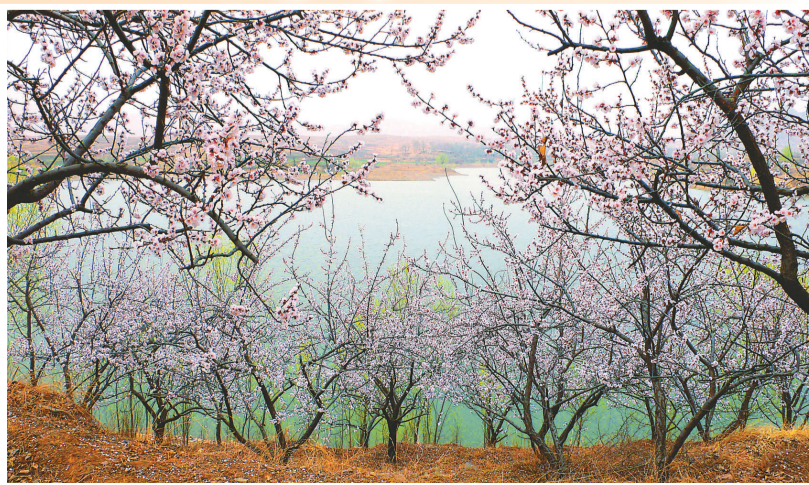
杏花盛開的牛王寨

行唐縣歷史悠久，古文化燦爛。春秋時舉行典禮、祭祀，都有「儀仗鼓樂」、「飲酒樂歌」。南、北朝民間傳說大興、隋、宋、元多用詞章，唐、清詩賦昌盛。清《行唐縣志》中設有關於「作詩四則」的篇章，即詩體、詩法、詩韻、諧聲。乾隆《行唐縣志》收入詩、詞70多首，其中知縣吳高增親自寫詩50首。清末進士尚秉和是蜚聲中外的著名學者，著作有《周易尚氏學》、《槐軒文集》等50多部。美術方面，現代著名油畫家秦征在國內外畫壇具有很大的影響。抗日戰爭時期，解放區的牆頭詩、歌曲、秧歌舞、東楊莊等村的劇團，活躍了農村文化生活，鼓舞了群眾鬥志。