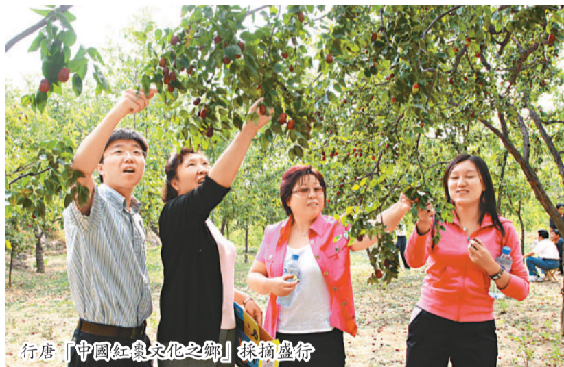
行唐「中國紅棗文化之鄉」採摘盛會

支柱產業、特色產業逐步形成。縣委、縣政府努力引導企業科學管理，科技創新，鼓勵企業優化產業結構，降低生產成本，提高產品質量，培育名牌產品。全縣逐步形成了食品飲料、礦產建材、機械製造、化工醫藥、電子信息五大工業支柱產業和「兩紅一白」農業特色產業。特別是化工產業中的立德粉，年產立德粉1.5萬噸，銷售量佔國內外市場份額的13%，是全國北方最大的立德粉生產基地；食品飲料產業中的奶製品，銷售量佔國內外市場份額的12%；電子材料主導產品為中高檔液晶材料和電致發光材料，年產液晶材料30噸，產值6億元，國內市場佔有率達5%。下一步，行唐將借力發展，把該縣建設成為華北重要的乳業生產加工基地、高新技術產業基地和非金屬礦產品加工出口基地。