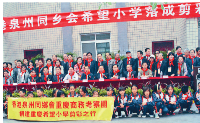
考察團參加香港泉州同鄉會希望小學落成剪綵儀式