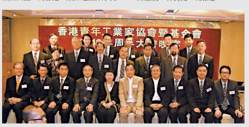
▲青年工業家協會新屆執委與來賓合影

該會榮譽顧問王敏剛講話讚揚協會在諸位會長及執委會努力下，會務蒸蒸日上，為香港工業界建立深厚友誼。他認為工業家要把握好內地來年擴大內需的機遇拓展業務。工業貿易署署長關錫寧致詞時對該會為香港工業發展作出貢獻表示感謝。她在提到最新的經濟情況及未來工業發展的路向時表示，在金融海嘯期間，政府推出一籃子措施協助業界渡過難關，包括加強現有的「中小企業信貸保證計劃」及推出一千億元的「特別信貸保證計劃」，成效顯著，推出以來共批出超過三萬九千宗申請，涉及的貸款達990億元，令超過二萬家企業受惠，協助穩住超過33萬個職位，其中來自製造業的企業申請約佔總數的三成。在品牌發展方面，工業貿易署去年與貿發局合辦了一個名為「打造品牌，開拓十萬億元內需市場」的高峰論壇，邀請了企業家分享在內地營商的經驗，今年十二月將於「國際中小企博覽」期間再次與貿發局合作舉辦品牌高峰論壇。