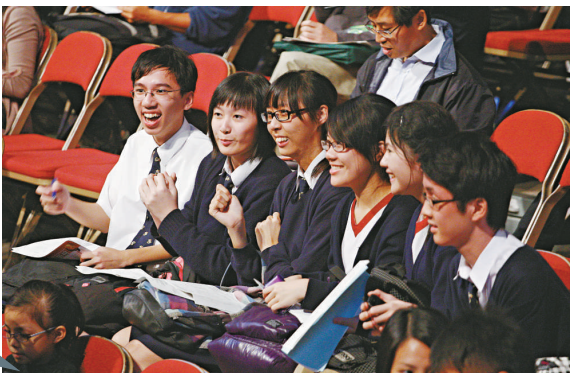
◀維園年宵乾貨攤位競投，吸引過百學生到場

「學生檔」多以兩萬餘元成交價為資本上限，投得攤位的學生，多數要繼續集資，才能北上廣州買受歡迎精品應市。中華基督教會公理高中書院的馬老師，昨率領十數名學生到伊館，結果學生以二萬二千六百元投得一個攤位。今年，已是學校第三年派學生做年宵生意，成績斐然，前年賺九成利潤，去年天冷仍有三、四成盈餘。學生代表陳同學說，雖未決定到廣州買什麼精品，人民幣又較港元貴，他們有信心賺兩、三成：「我們有相熟店舖，購入精品應只比去年貴一元。」學生們暫只需得二萬元，陳同學說，回到學校會加強宣傳，期望全校集資達六萬元：「今次是每股一百元，不限幾多手。」籌夠錢後，馬老師會帶學生到廣州採購。