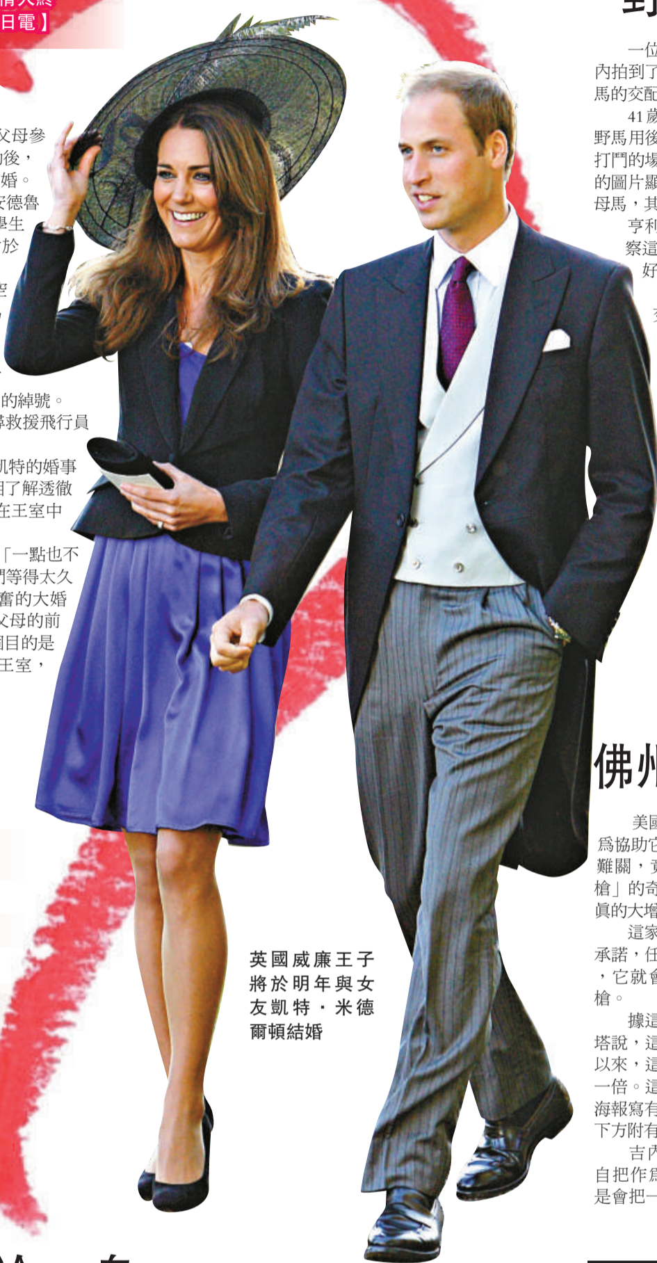
英國威廉王子將於明年與女友凱特·米德爾頓結婚

英國HELLO雜誌負責人說：「一點也不突然，誰都想祝福他們。因為我們等得太久了。我看好他們，期待着令人興奮的大婚時刻到來。」她說，威廉因為有父母的前車為鑑，與凱特拍拖這麼久，一個目的是想凱特充分了解她的將來，認識王室，認識她的責任。