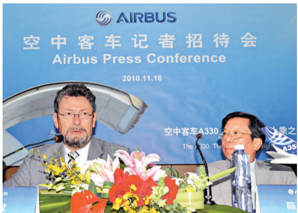
▲博龍(左)認為，C919無礙市場自由競爭