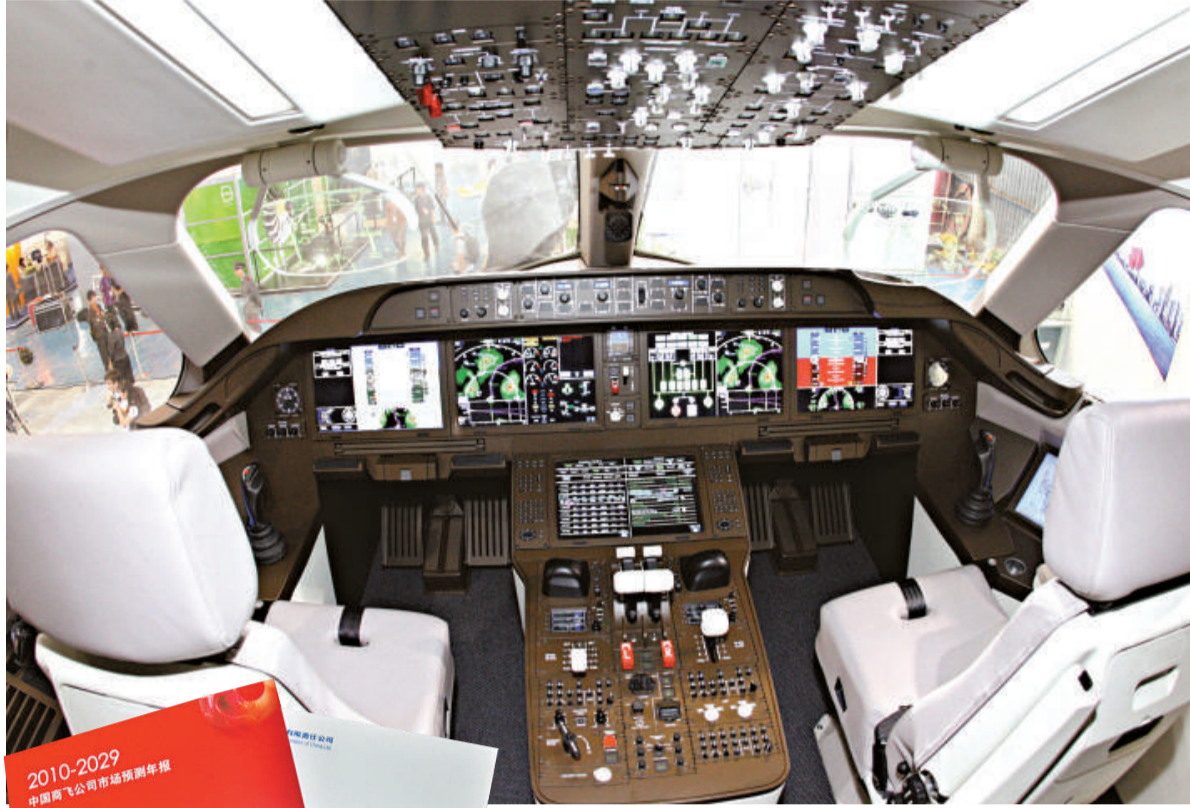
▲ C919客機可容納190名乘客，是中國的第一款大型國產客機駕駛室布局與儀錶板令人刮目相看