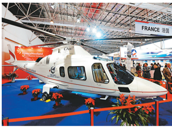
▲法國展商展出的多用途輕型直升機

中國商飛又稱，世界民用飛機發展更加關注「綠色環保」和更好的經濟性指標，緊緊圍繞進一步提高氣動效率、結構效率、動力系統效率和設備可靠性以形成突破；民用飛機技術將集中於綜合優化、新材料應用、人機環境、環保低耗等領域，設計原則也由追求最好性能向追求可接受性能下的低成本方向轉變，信息化與工程化的融合成為未來先進民用飛機的重要技術特徵。