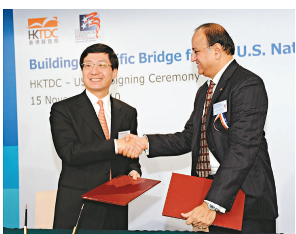
▲貿發局總裁林天福(左)與美國商務部助理部長庫馬爾交換協議計劃文本

美國商務部助理部長庫馬爾前日在香港與香港貿易發展局簽訂太平洋商貿合作計劃(PBI)時稱，船公司