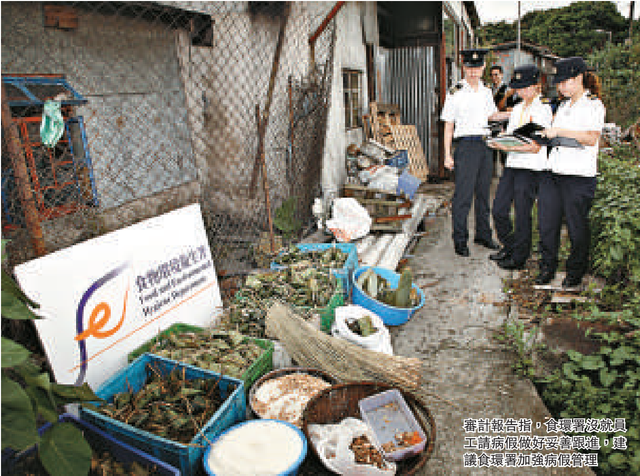
審計報告指，食環署沒就員工請病假做好妥善跟進，建議食環署加強病假管理