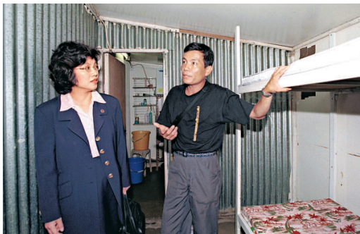
▲審計署發現，本港戒毒中心工作量不均，傾重於六間受資助中心

審計署建議基金秘書處應設立申請評分制度，以反映資助計劃能否持續發展，並提供有效的指引及支援，協助受資助者改善計劃，以及鼓勵更多合資格機構申請撥款。