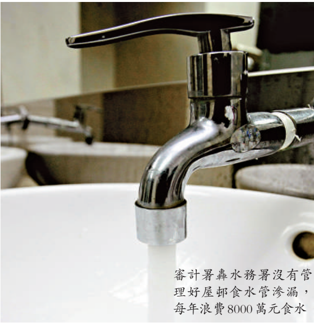
審計署轟水務署沒有管理好屋邨食水管滲漏，每年浪費8000萬元食水

審計署同時發現，一幅位於大嶼山的戒毒中心用地，自一九九三年開始，以象徵式租金租給一間非政府機構後，相關部門後來沒有監察，導致有關用地在過去十六年，大部分時間都被閒置。